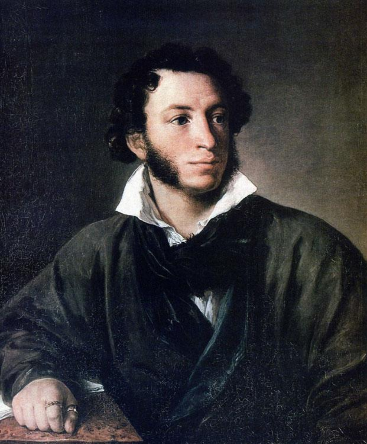
Александр Сергеевич Пушкин