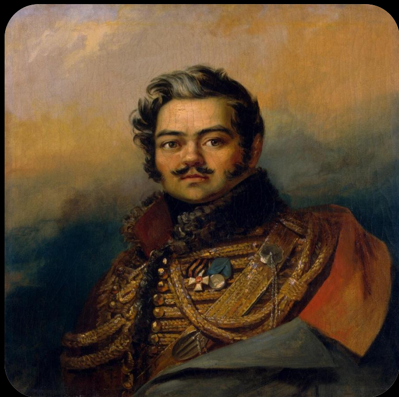
Денис Васильевич Давыдов

Ещё будучи воспитанником Лицея, Пушкин вошёл в литературное общество «Арзамас», выступавшее против рутинны и архаики в литературном деле, и принял действительное участие в полемике с объединением «Беседа любителей русского слова», отстаивавшим каноны классицизма прошлого века