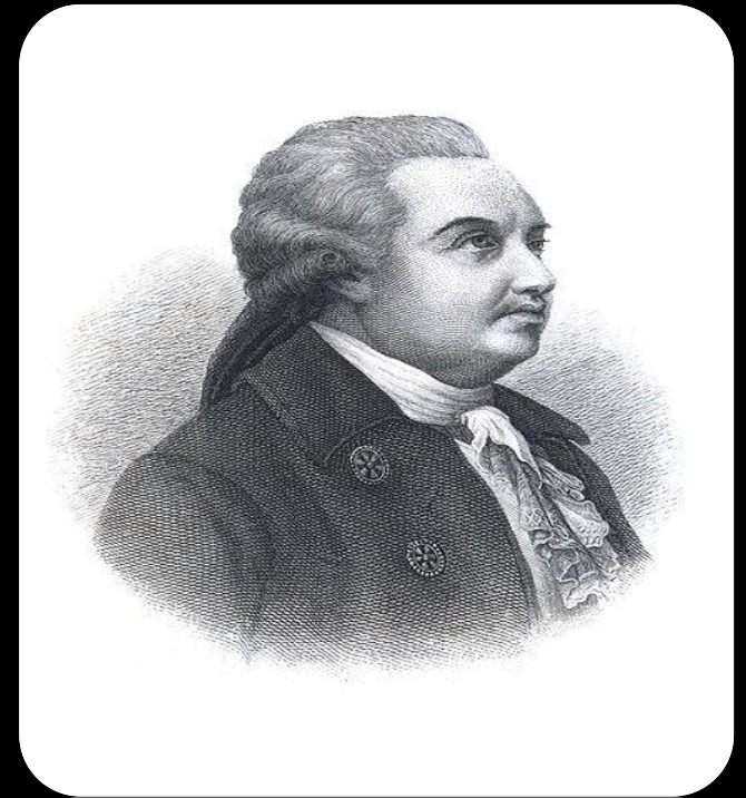
Денис Иванович Фонвизин