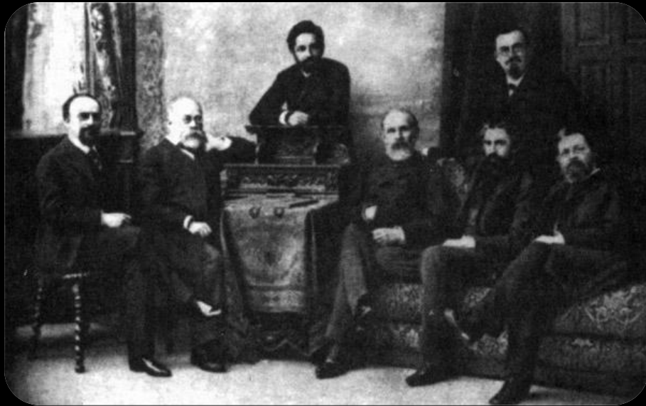
Издательство «Вестник Европы»

В июле 1814 года Пушкин впервые выступил в печати в издававшемся в Москве журнале «Вестник Европы». В тринадцатом номере было напечатано стихотворение «К другу-стихотворцу», подписанное псевдонимом Александр Н.к.ш.п