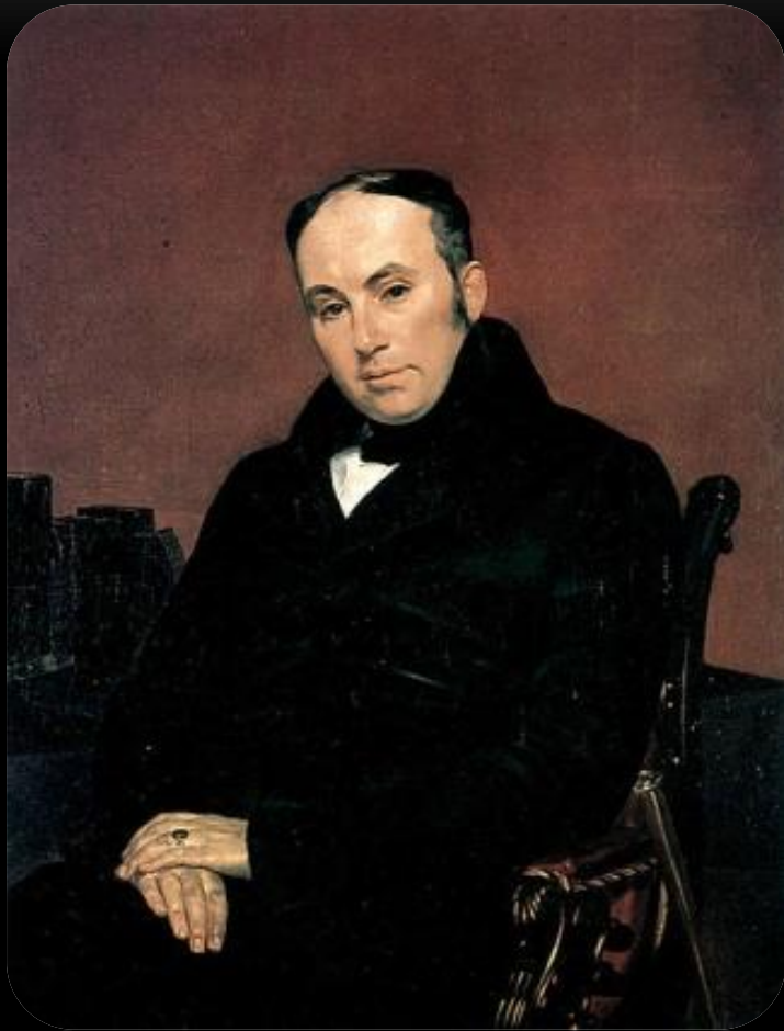
Василий Андреевич Жуковский

В его ранней лирике соединились традиции французского и русского классицизма. Учителями Пушкина-поэта стали Батюшков, признанный мастер «лёгкой поэзии», и Жуковский, глава отечественного романтизма