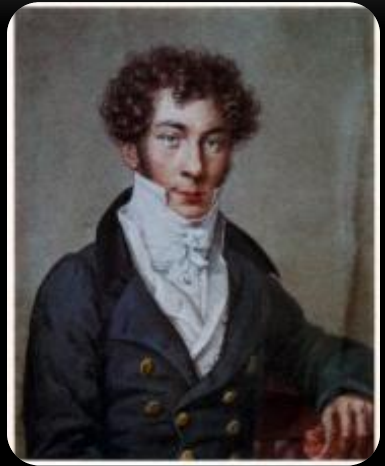
Константин Николаевич Батюшков