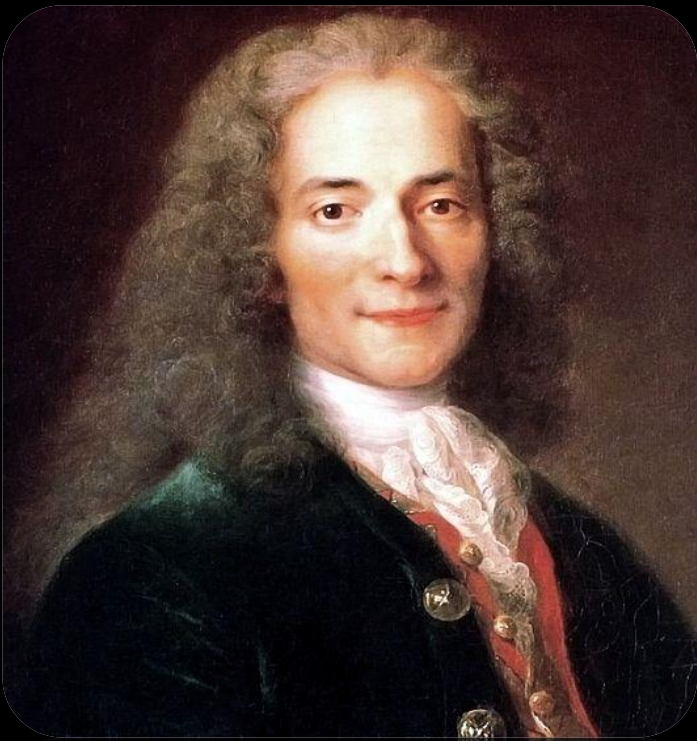
Франсуа-Мари Аруэ (Вольтер)

В лицейский период Пушкиным было создано много стихотворных произведений. Его вдохновляли французские поэты XVII—XVIII веков, с творчеством которых он познакомился в детстве, читая книги из библиотеки отца. Любимыми авторами молодого Пушкина были Вольтер и Парни