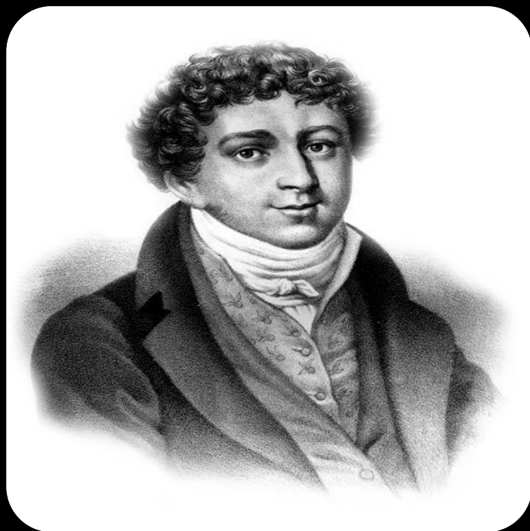
Батюшков Константин Николаевич