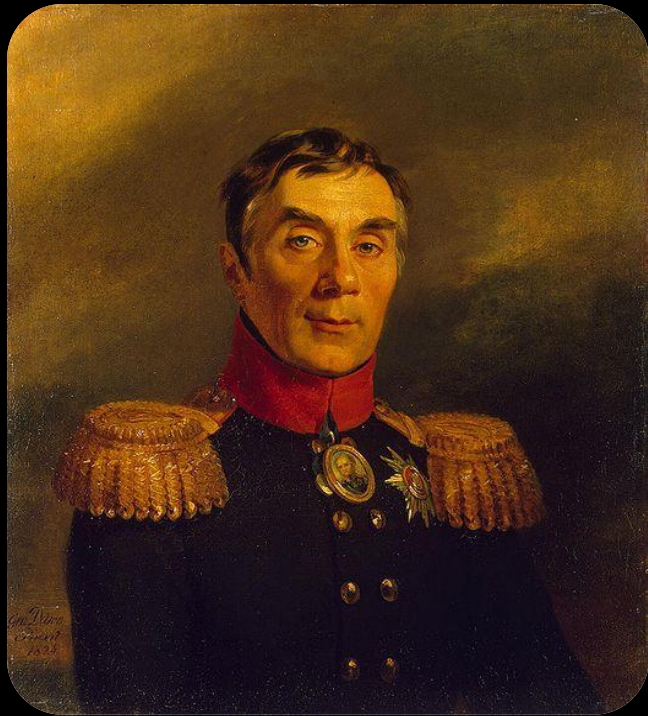
Алексей Андреевич Аракчеев

А в пушкинском послании «Лицинию» критически изображена современная жизнь России, где в образе «любимца деспота» выведен Аракчеев. Уже в начале своего творческого пути он проявлял интерес к русским писателям-сатирикам прошлого века. Влияние Фонвизина чувствуется в сатирической поэме Пушкина «Тень Фонвизина» (1815); с творчеством Радищева связаны «Бова» (1814) и «Безверие»