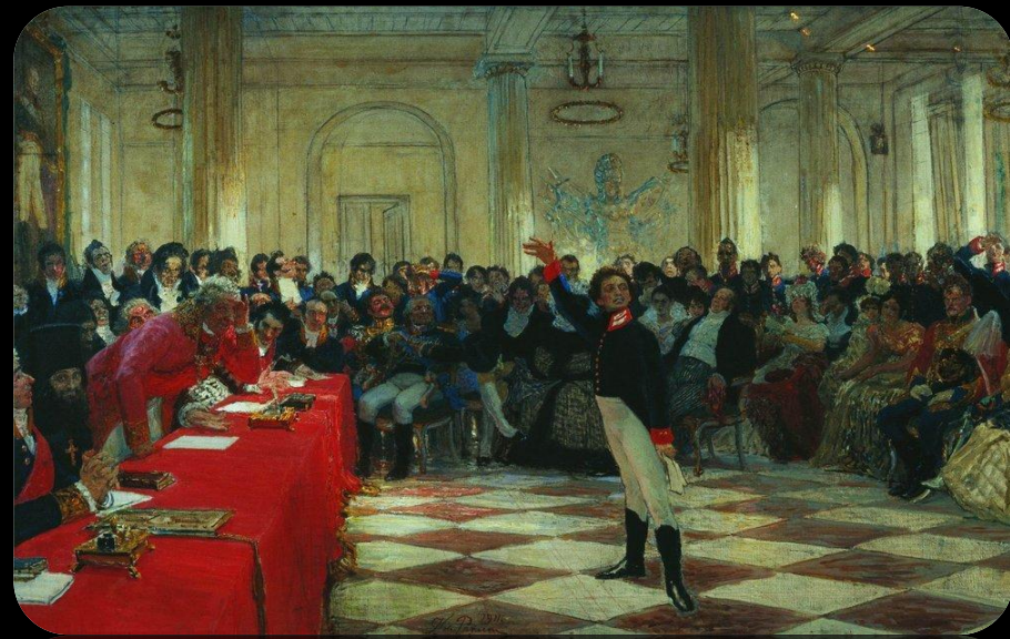
Пушкин на лицейском экзамене в Царском Селе. Картина И. Репина