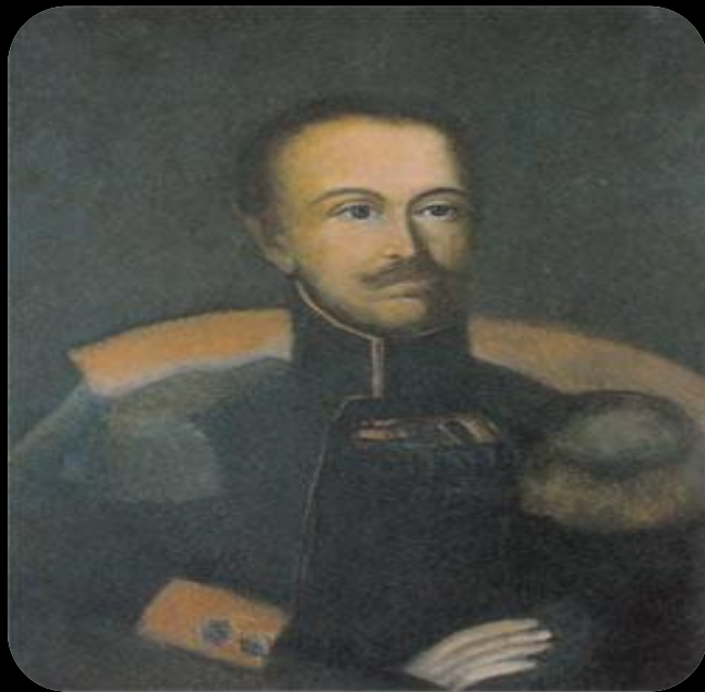
Павел Александрович Катенин

Из Лицея Пушкин был выпущен в июне 1817 года в чине коллежского секретаря (10-го класса, по табели о рангах) и определён в Коллегию иностранных дел. Он становится постоянным посетителем театра, принимает участие в заседаниях «Арзамаса» (принят он был туда заочно, ещё будучи учеником Лицея), в 1819 году вступает в члены литературно-театрального сообщества «Зелёная лампа», которым руководит «Союз благоденствия»