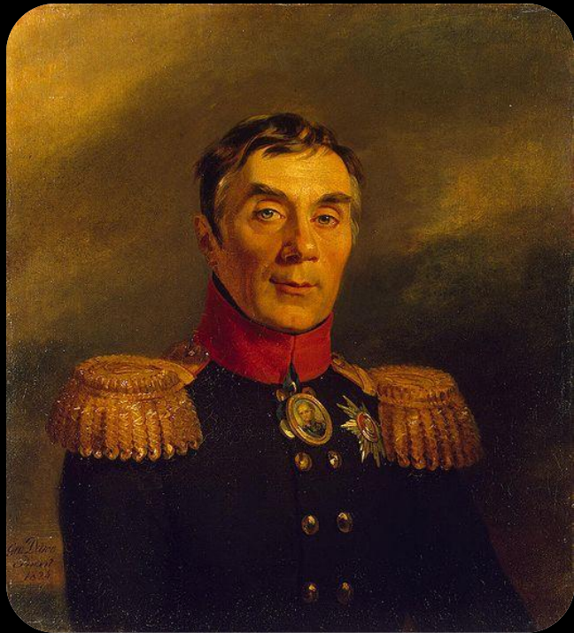
Алексей Андреевич Аракчеев

А в пушкинском послании «Лицинию» критически изображена современная жизнь России, где в образе «любимца деспота» выведен Аракчеев. Уже в начале своего творческого пути он проявлял интерес к русским писателям-сатирикам прошлого века. Влияние Фонвизина чувствуется в сатирической поэме Пушкина «Тень Фонвизина» (1815); с творчеством Радищева связаны «Бова» (1814) и «Безверие»