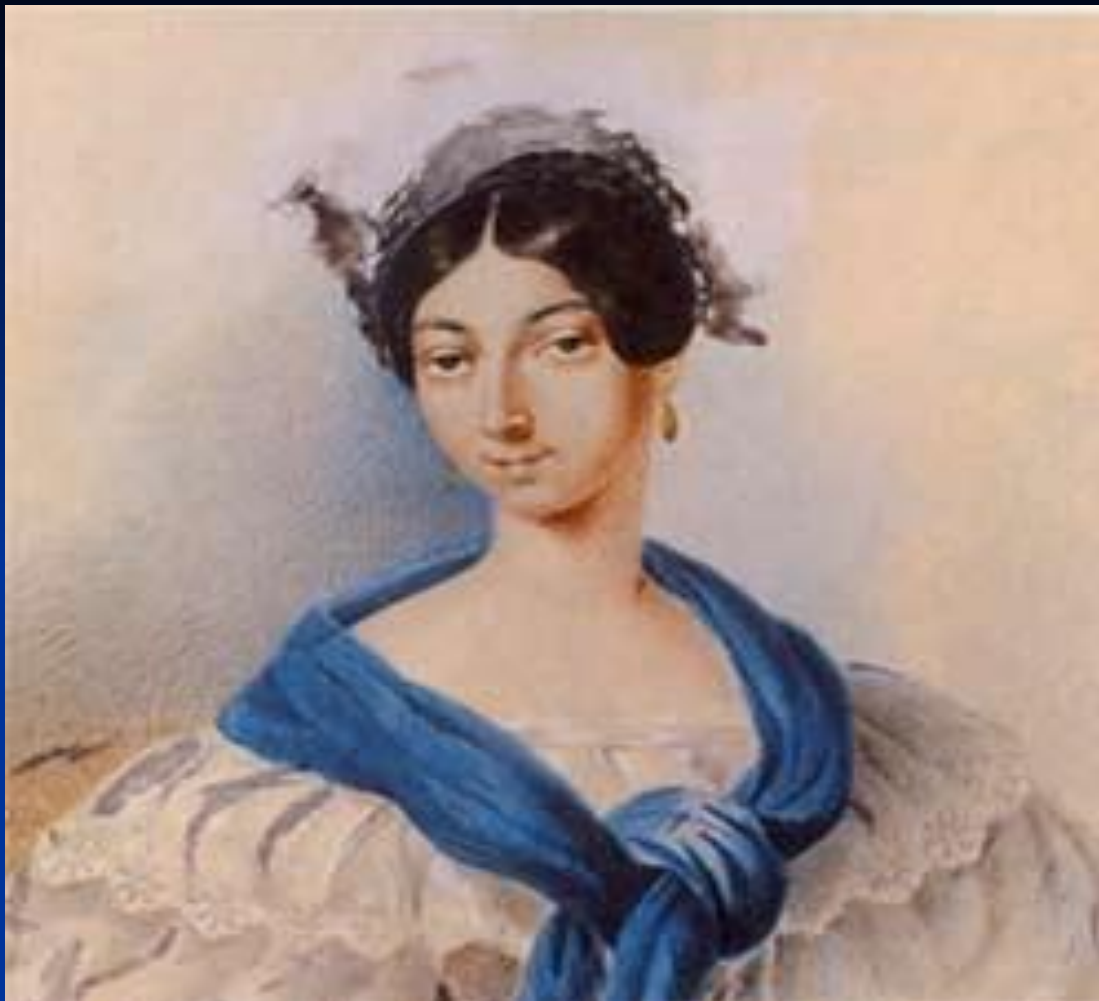
Павлишцева Ольга Сергеевна, рожд. Пушкина (1797-1868) — сестра поэта.