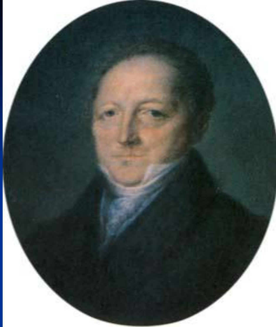
Сергей Львович Пушкин (1770- 1848), отец поэта.