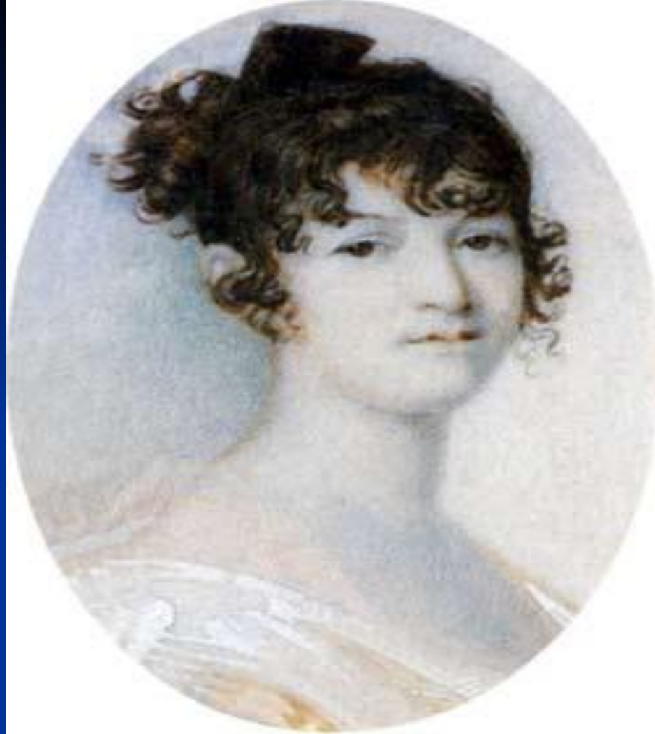
Надежда Осиповна Пушкина, рожд. Ганнибал (1775-1836), мать поэта.