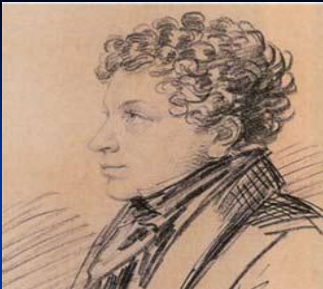
Пушкин Лев Сергеевич (1805-1852) — брат поэта.