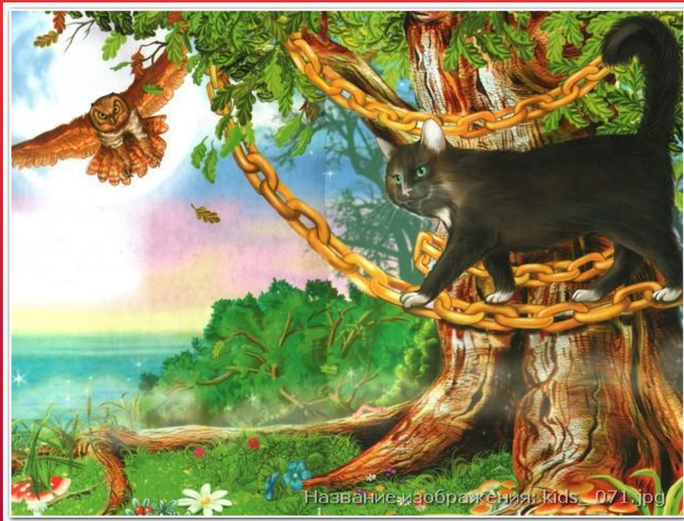
Златая цепь на дубе том...