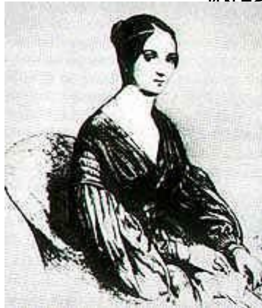
Анна Петровна Керн 1800-1879г.