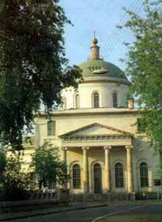
Храм Вознесения, где венчался Пушкин с Гончаровой