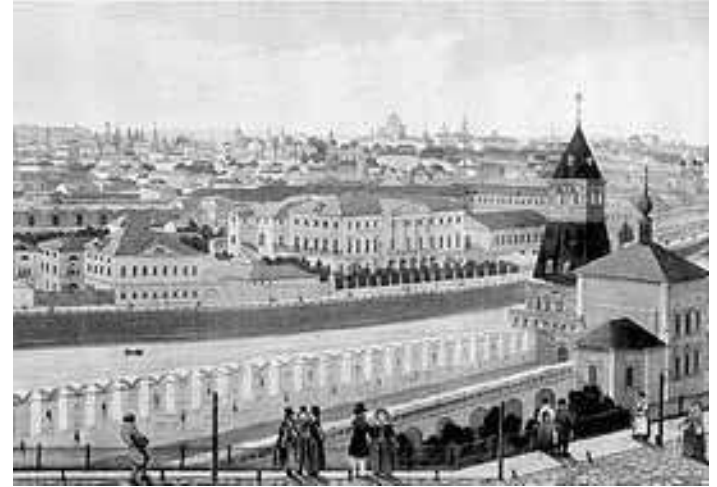
Вид части города с Кремлевской стены