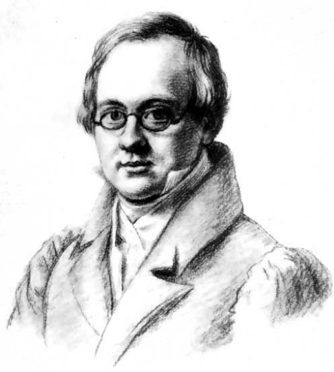
А.П. Дельвиг В.П. Лангер. 1830г.