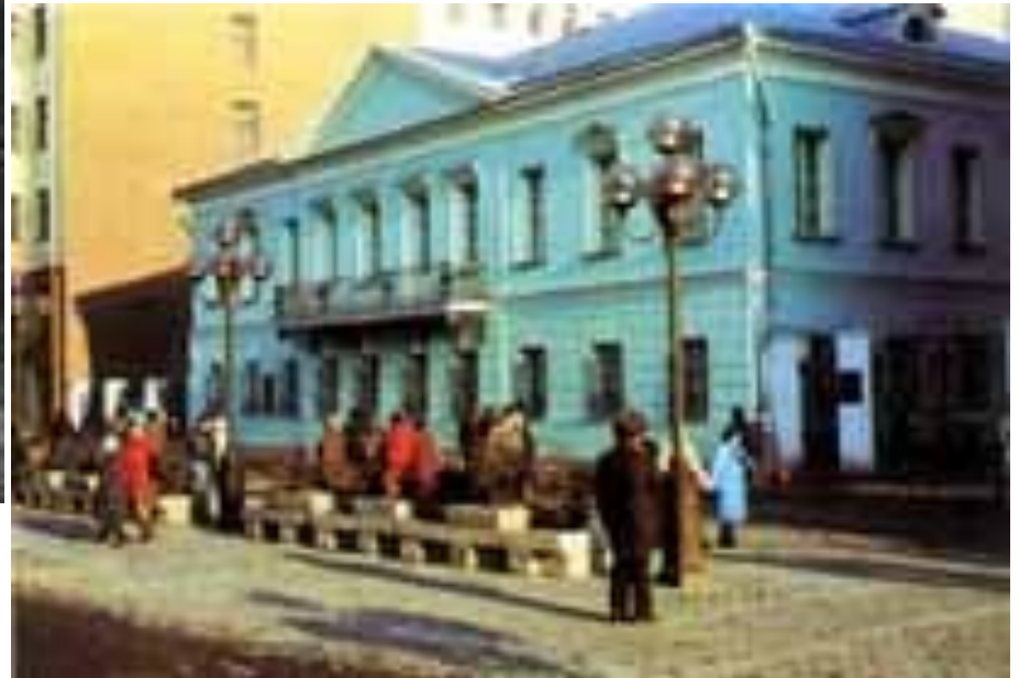
Квартира Пушкина на Арбате.