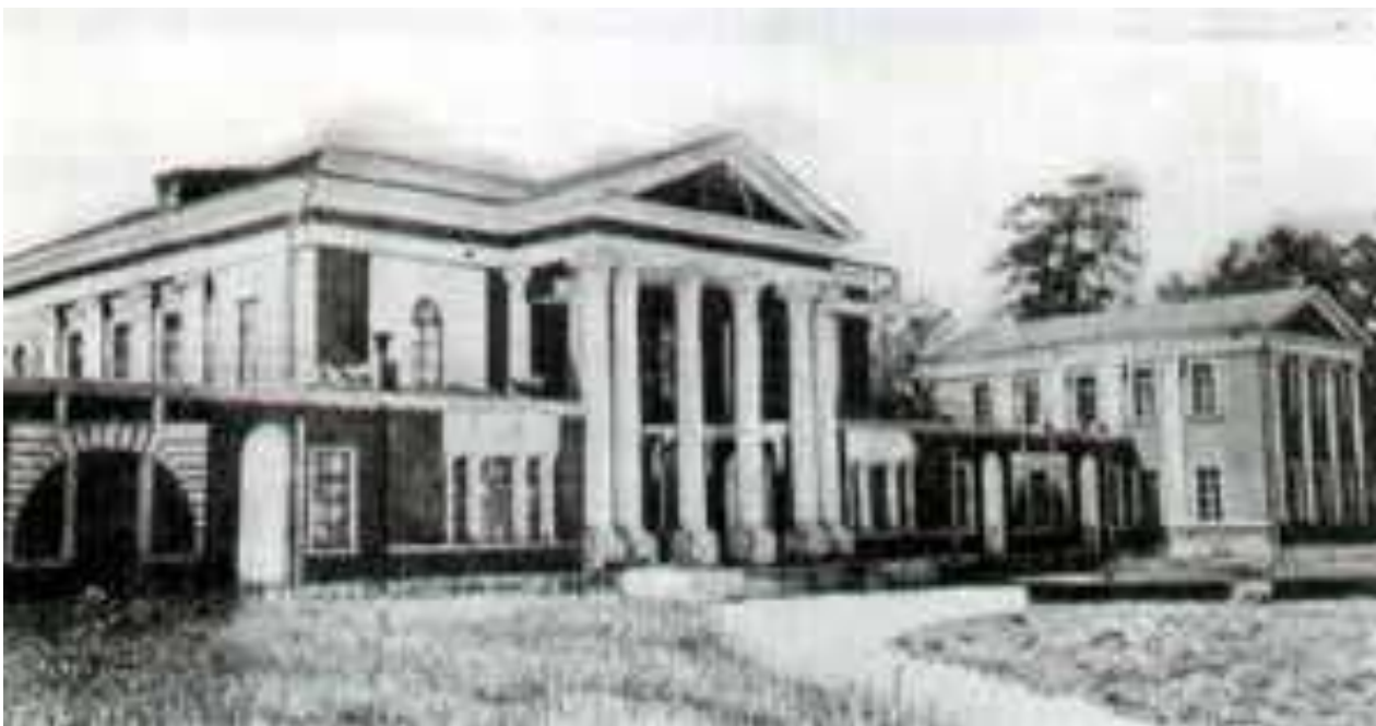
Дворец Гончаровых в Яропольце