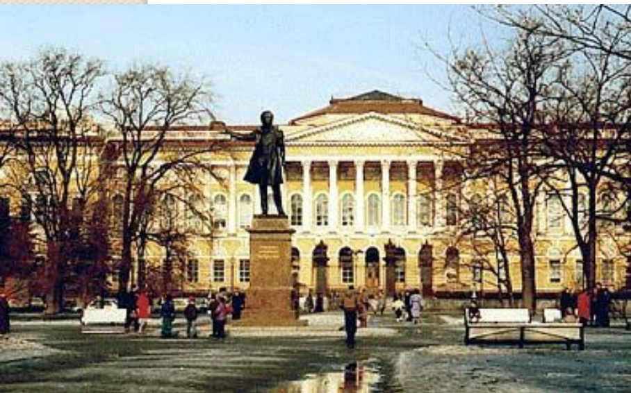
Санкт-Петербург. Памятник Пушкину на площади искусств.

Люблю тебя, Петра творенье, Люблю твой строгий, стройный вид, Невы державное течение, Береговой ее гранит, Твоих оград узор чугунный, Твоих задумчивых ночей Печальный сумрак, свет безлунный... (А.С. Пушкин "Медный всадник")