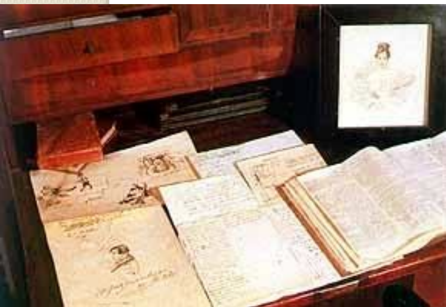
Бюро с портретом Н.Н. Пушкиной в кабинете поэта

Последний раз поэт приезжал в Болдино осенью 1834 г. по запутанным делам имения и прожил там месяц. Но в этот раз он был настолько утомлен и истерзан душевно, что в середине октября вернулся в Петербург, написав лишь "Сказку о золотом петушке". В мае 1835 г. в письме к болдинскому управляющему поэт писал: "В июне думаю быть у вас". Однако намерения поэта не осуществились.