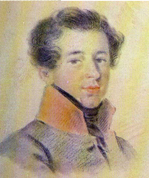
А.М. Горчаков Неизв. худ. 1810-е г.