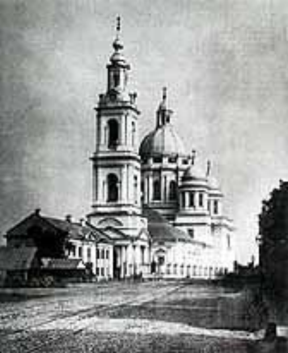
Елоховский собор, в котором крестили Пушкина