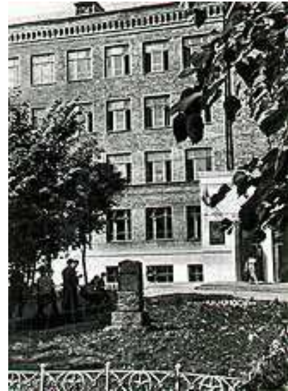
353-я школа имени А.С. Пушкина в Москве