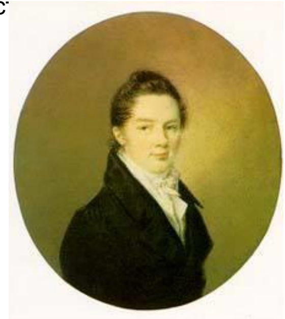
И.И. Пуцин . Ф. Верне. 1817г.