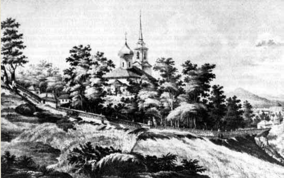
Святогорский монастырь и могила Пушкина. Литография по рис. И.Иванова. 1838 г.