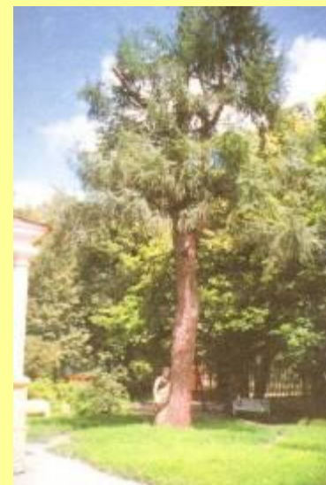
Лиственница, посаженная А. С.Пушкиным осенью 1833 г.