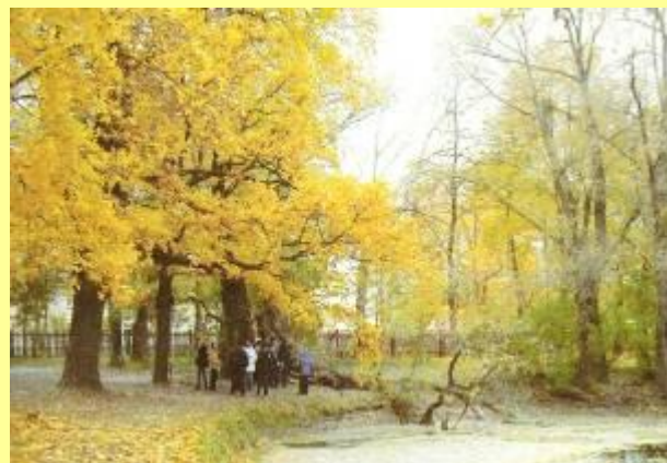
Древняя ветла – около 250 лет