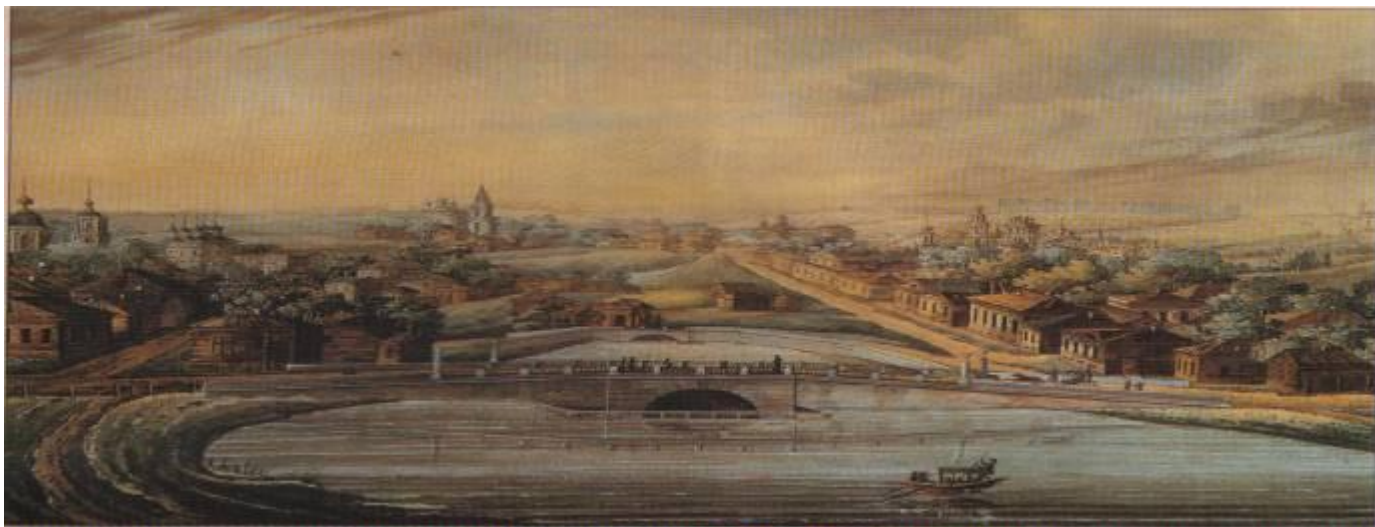
Неизвестный художник. Москва. Прасненские пруды. 1800-е гг.