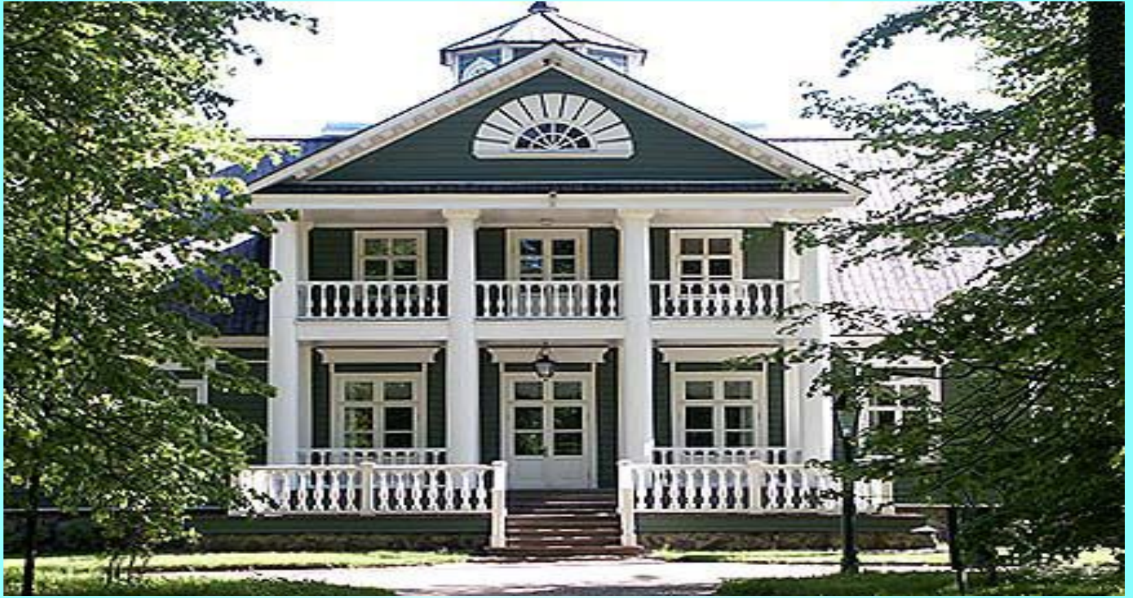
Петровское. Большой господский дом («дом П.А. Ганнибала»).