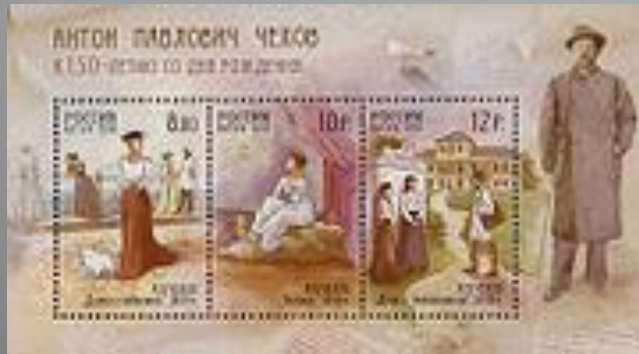
Почтовый блок России, 2010 год: произведения А. П. Чехова