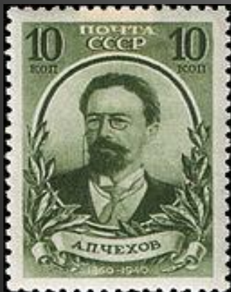
Почтовая марка СССР, 1940 год