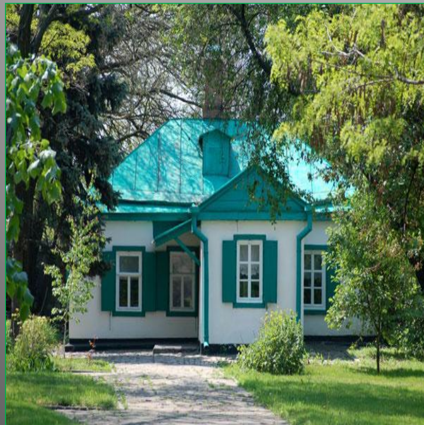
Отчий дом писателя в Таганроге