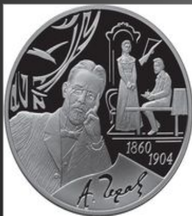
3 рубля из серебра