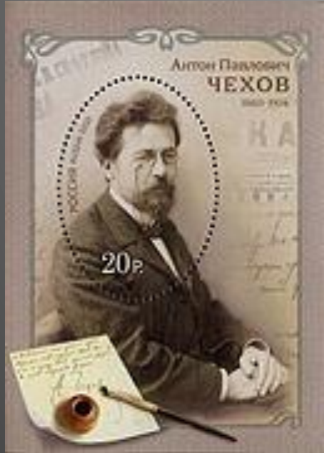
Почтовый блок России к 150-летию со дня рождения А. П. Чехова