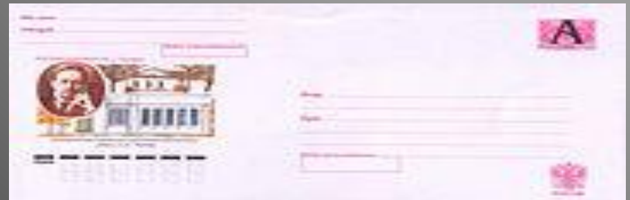
Почтовый конверт России, 2004 год