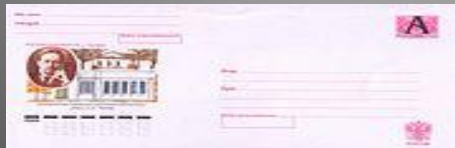
Почтовый конверт России, 2004 год