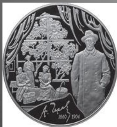
100 рублей из серебра