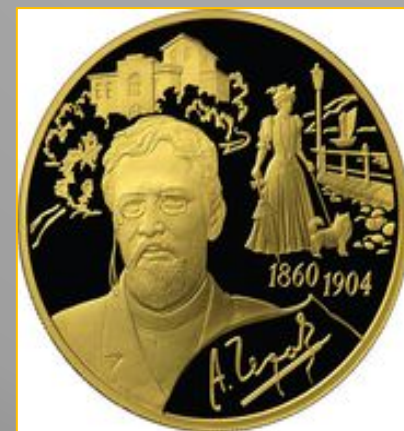
200 рублей из золота