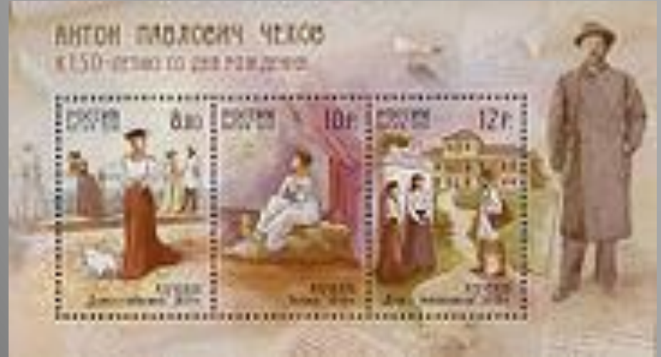
Почтовый блок России, 2010 год: произведения А. П. Чехова