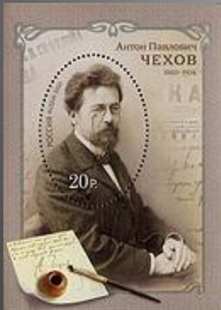
Почтовый блок России к 150-летию со дня рождения А. П. Чехова