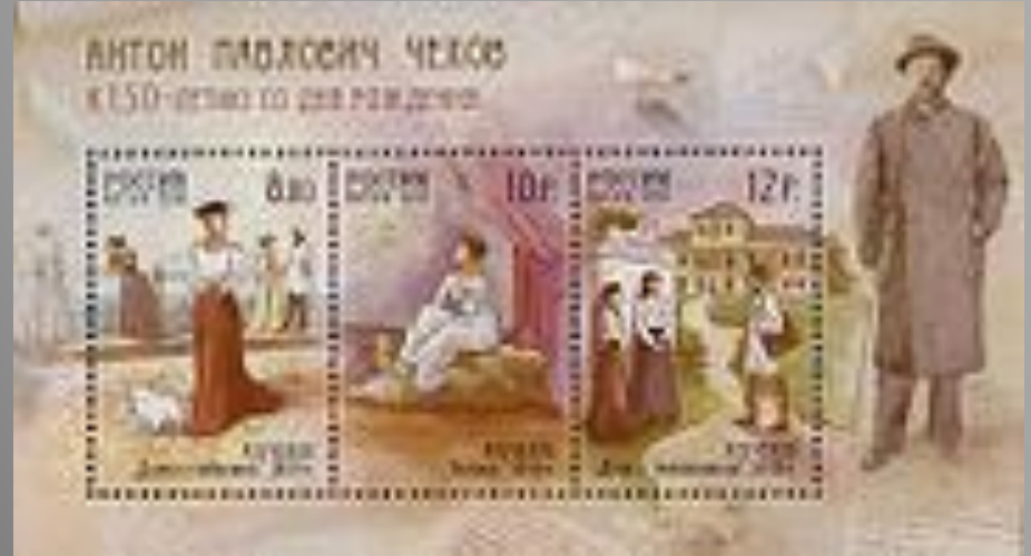
Почтовый блок России, 2010 год: произведения А. П. Чехова