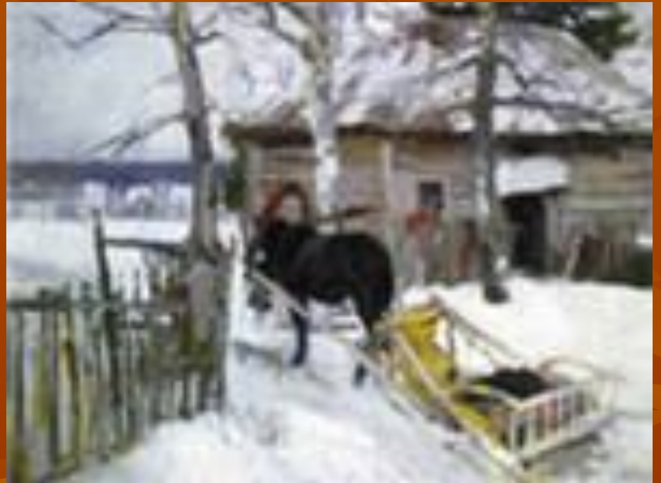
К.А. Коровин . Зимой