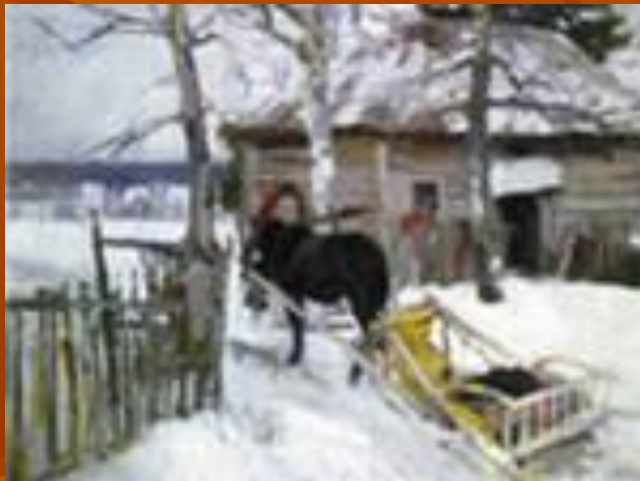
К.А. Коровин . Зимой