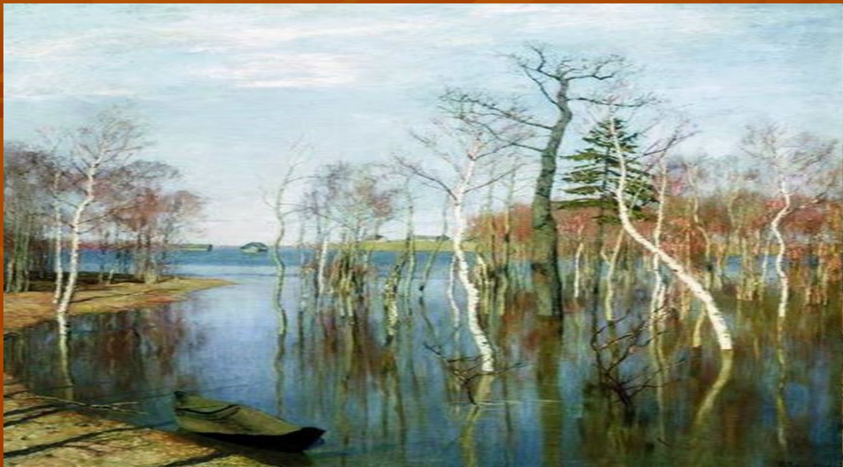
Левитан Исаак Ильич. Весна. Большая вода. 1897г