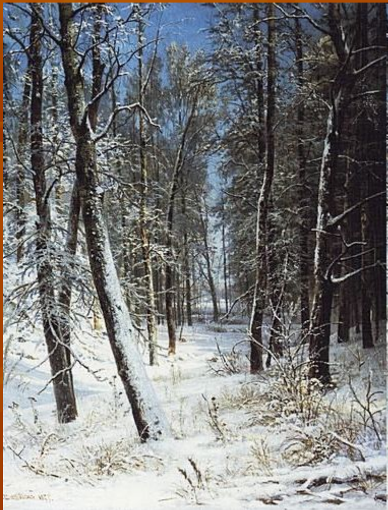
И.И.Шишкин «Зима в лесу»