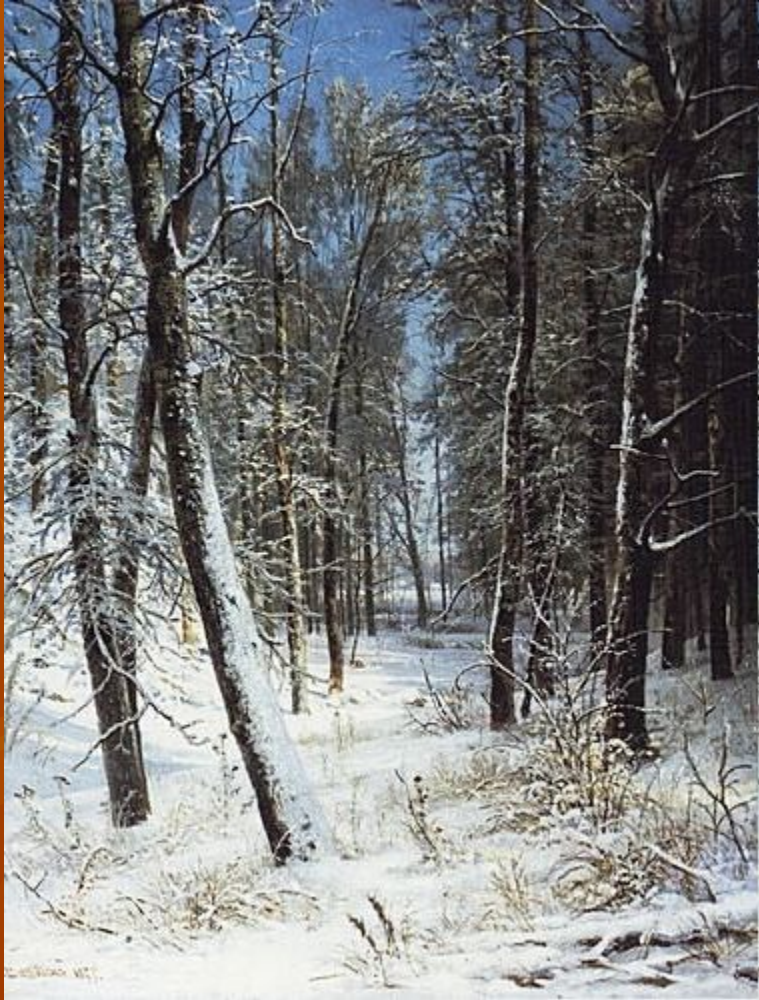
И.И.Шишкин «Зима в лесу»