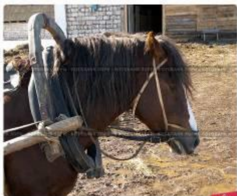
Уставшая лошадь