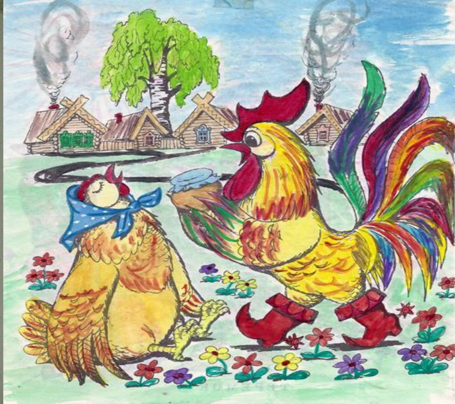
КОЛОДЕЦНИК С. ИЛЛЮСТРАЦИИ В. ПЕТУШОК И БОБОВОЕ ЗЕРНЫШКО