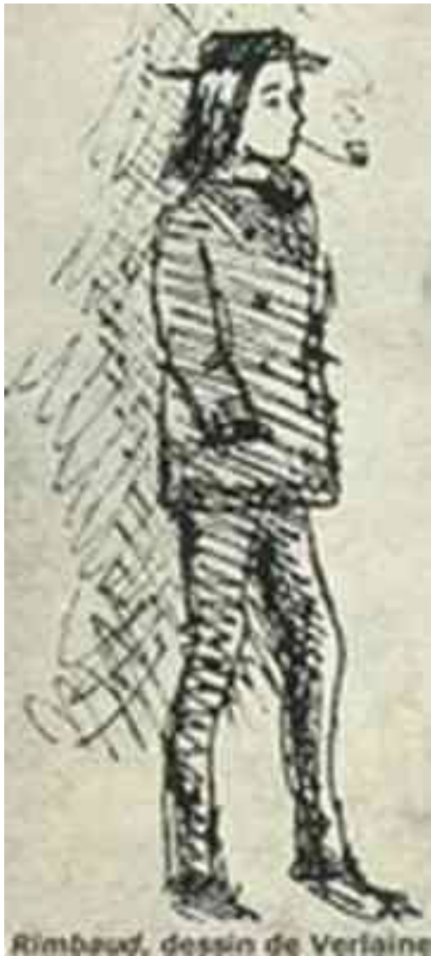
Rimbaud, dessin de Verlaine

«Прокляття райдугою» значилося на його житті алахом поетичної зрілості рідким згасанням його ї зірки: ті тридцять сім илося прожити Рембо на ростійним духовним ом і авантюрою. Ключове зуміння всього того, що им, - «пошук», пошук ідеалу і невідомого.