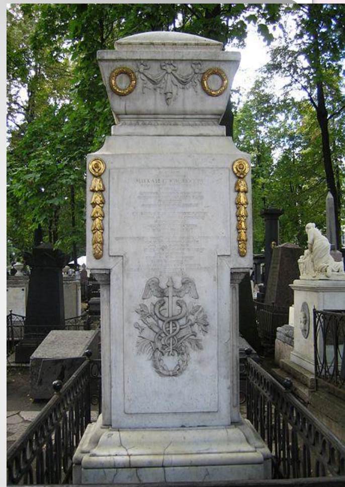
Могила М.В.Ломоносова в Александро – Невской лавре

Я знак бессмертия себе воздвигнул Превыше пирамид и крепче меди, Что бурный Аквилон сотреть не может Ни множество веков, ни една древность. Не вовсе я умру, но смерть оставит Велику часть мою, как жизнь скончаю. Я буду возрастать повсюду славой, Пока великий Рим владеет светом.