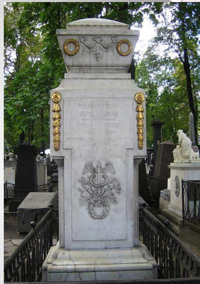
Могила М.В.Ломоносова в Александро – Невской лавре

Я знак бессмертия себе воздвигнул Превыше пирамид и крепче меди, Что бурный Аквилон сотреть не может Ни множество веков, ни една древность. Не вовсе я умру, но смерть оставит Велику часть мою, как жизнь скончаю. Я буду возрастать повсюду славой, Пока великий Рим владеет светом.