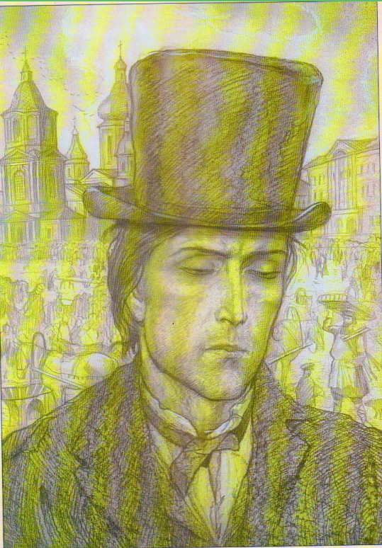
И.Глазунов. Иллюстрация к роману Ф.М.Достоевского «Преступление и наказание». 1986

и Базаров: МОЖНО ЛИ СТРОИТЬ ЖИЗНЬ ПО ТЕОРИИ?