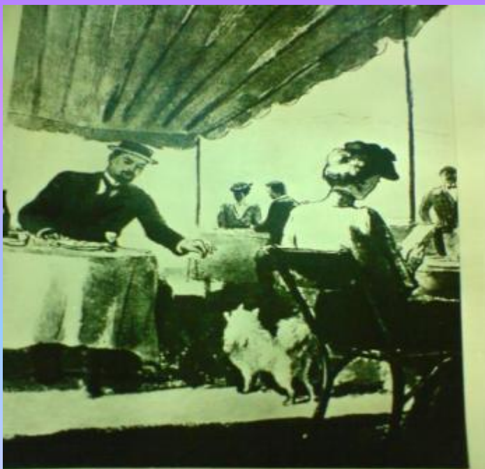
„Дама с собачкой“

Чехов в своем творчестве уделял огромное внимание миру сложных, зачастую непредсказуемых движений человеческой души и особенно чувству любви. Безусловно, любовь - самое светлое и прекрасное чувство, но жизнь в обществе накладывает на человека ограничения и запреты, призванные направить могучую стихию любви в спокойное семейное русло, где страсть узаконена и становится лишь одним из элементов повседневной жизни. В России во время Чехова были очень сильны патриархальные представления о любви и браке. Считалось вполне нормальным жениться и выходить замуж не по любви, а либо по "разумному расчету", либо по договоренности родителей, либо из каких-то других соображений житейского здравого смысла. Однако прожить без любви или же загнать в тесные рамки живое свободное чувство далеко не просто.