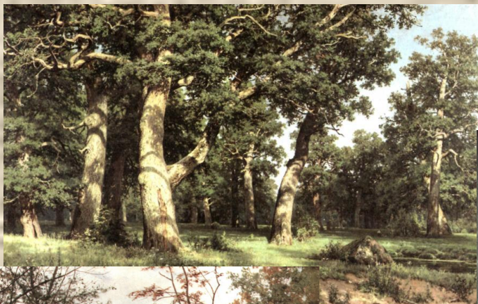
И.И.Шишкин «Дубовая роща»