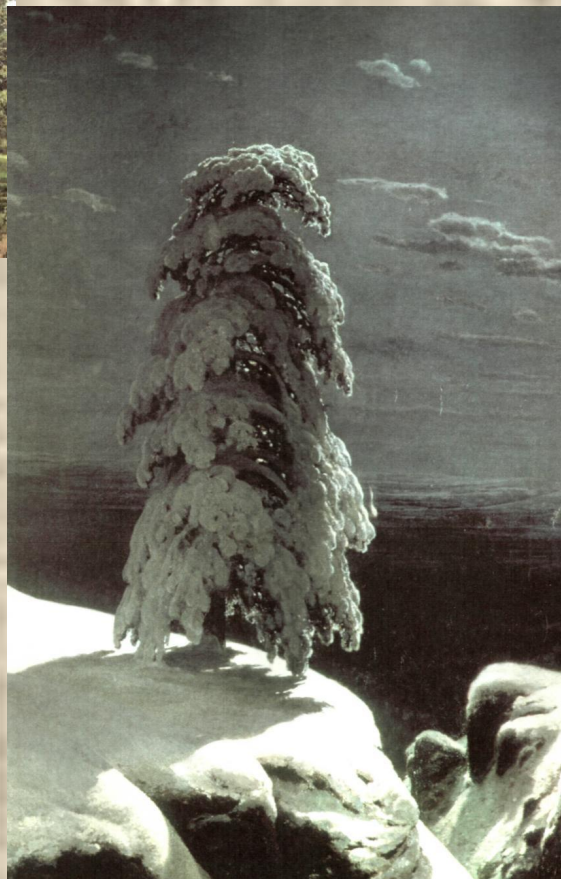
И.И.Шишкин «На севере диком...»