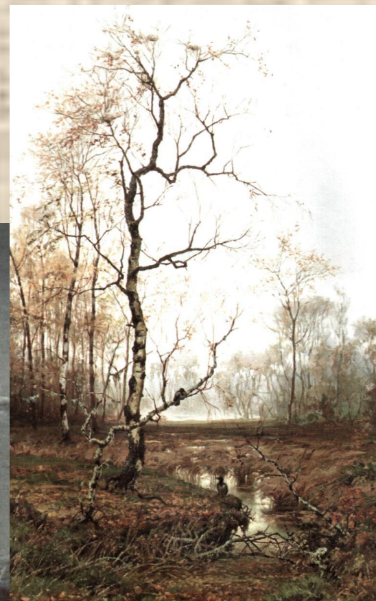
Ефим Волков «В лесу. По весне.»