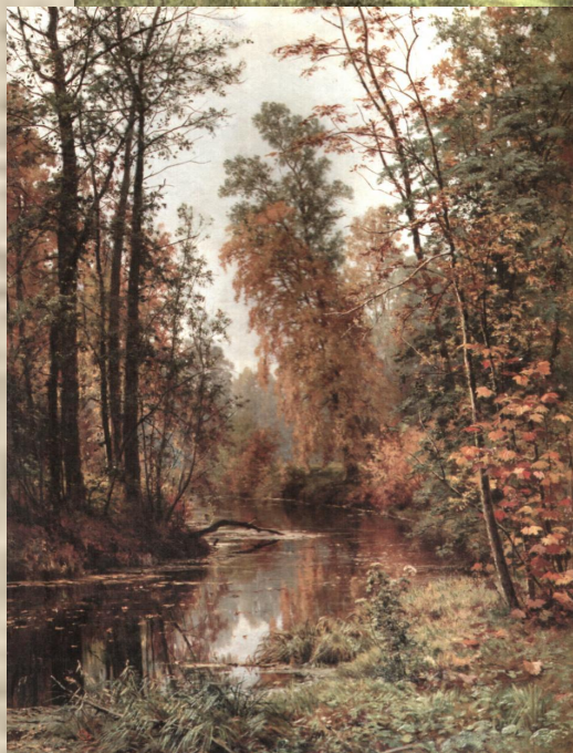
И.И.Шишкин «Парк в Павловске.»