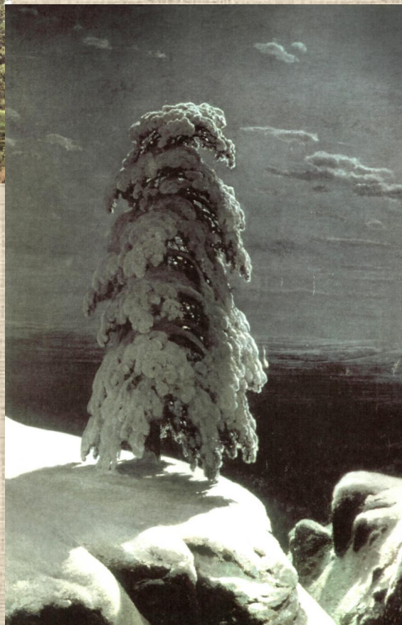
И.И.Шишкин «На севере диком...»