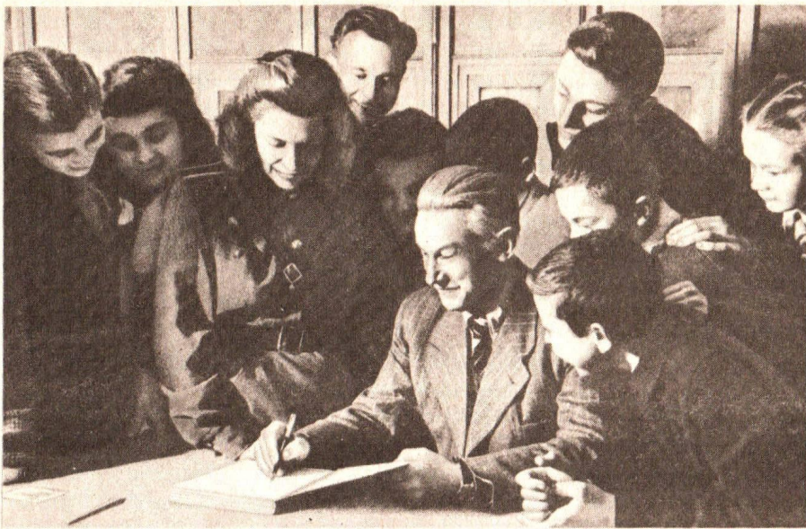
А. Фадеев среди детей. 19.IX.1946 г. Неделя детской книги.