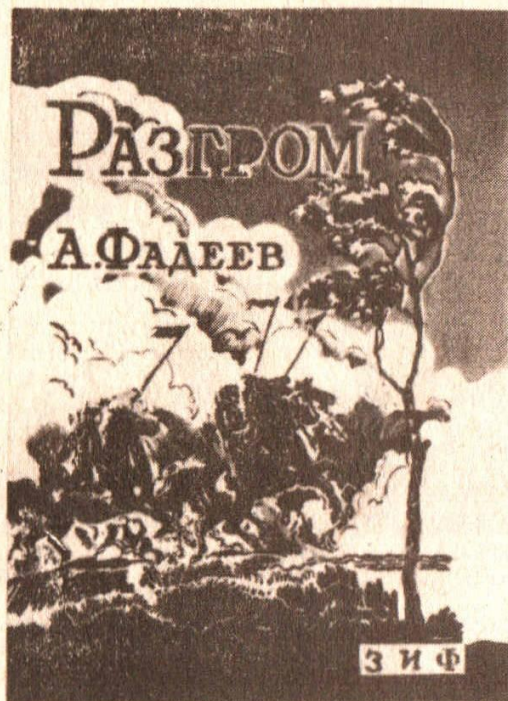
Обложка одного из первых изданий романа А. Фадеева «Разгром».

“В гражданской войне происходит отбор человеческого материала, всё враждебное сметается революцией, всё неспособное к настоящей революционной борьбе, случайно попавшее в лагерь революции отсеивается, а всё поднявшееся из подлинных корней революции, из миллионных масс народа, закаляется, растёт, развивается в этой борьбе. Происходит огромнейшая переделка людей”.