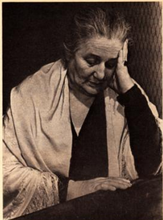
А. А. Ахматова. 1960