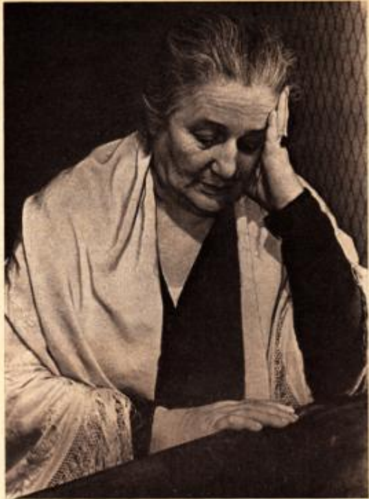
А. А. Ахматова. 1960

И Бога глас ко мне воззвал: «Восстань, пророк, и виждь, и немли, Исполнись волею моей, И, обходя моря и земли, Глаголом жги сердца людей».