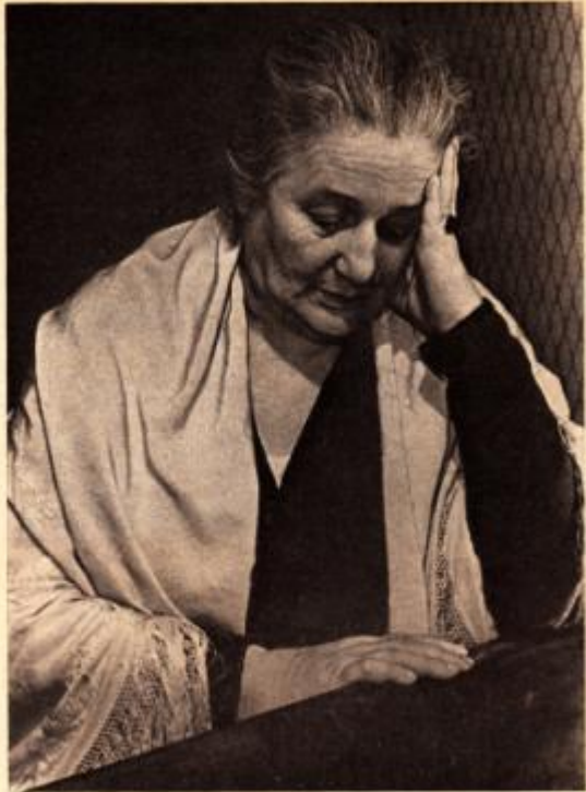
А. А. Ахматова. 1960

И Бога глас ко мне воззвал: «Восстань, пророк, и виждь, и внемли, Исполнись волею моей, И, обходя моря и земли, Глаголом жги сердца людей».