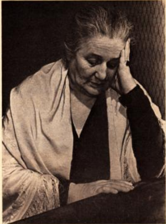
А. А. Ахматова. 1960

И Бога глас ко мне воззвал: «Восстань, пророк, и виждь, и внемли, Исполнись волею моею, И, обходя моря и земли, Глаголом жги сердца людей».