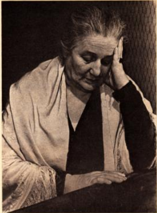
А. А. Ахматова. 1960

И Бога глас ко мне воззвал: «Восстань, пророк, и виждь, и внемли, Исполнись волею моею, И, обходя моря и земли, Глаголом жги сердца людей».