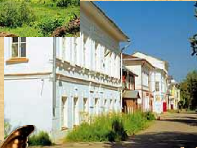
Улица со старыми домами, по которой могли гулять герои «Ревизора»