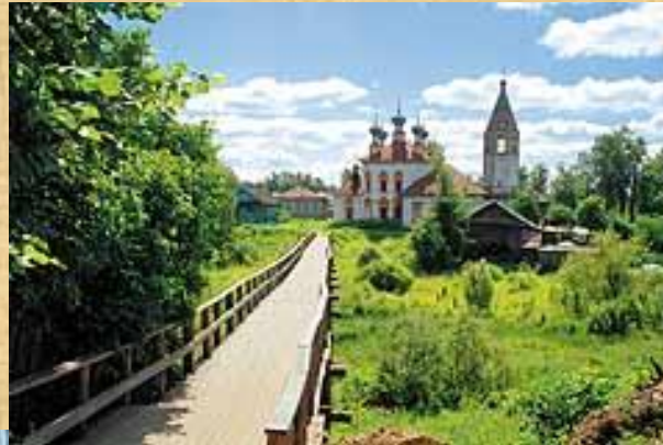
Почти центр города...

Ю.Манн, литературовед: «Сила «Ревизора» в том, что это особый город. Все нормы общежития, обращения людей друг к другу выглядят как повсеместные..Перед нами весь мир русской жизни, «вся Русь»