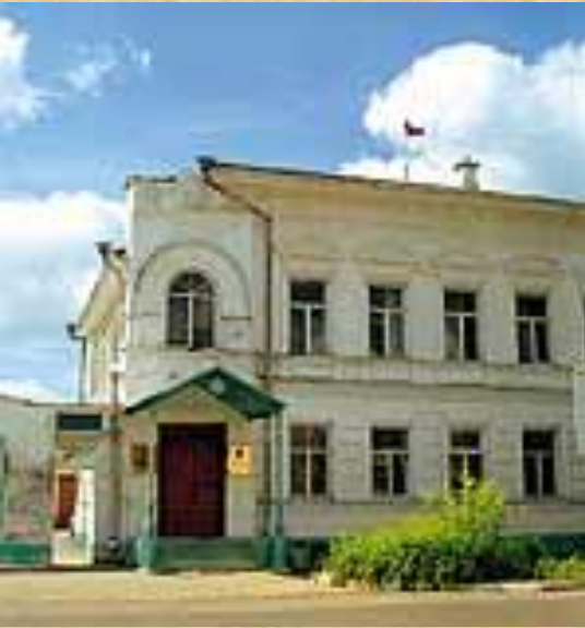
Дом администрации города, в котором мог управлять делами Городничий

Городничий: «Да отсюда, хоть три года скачи, ни до какого государства не доедешь»