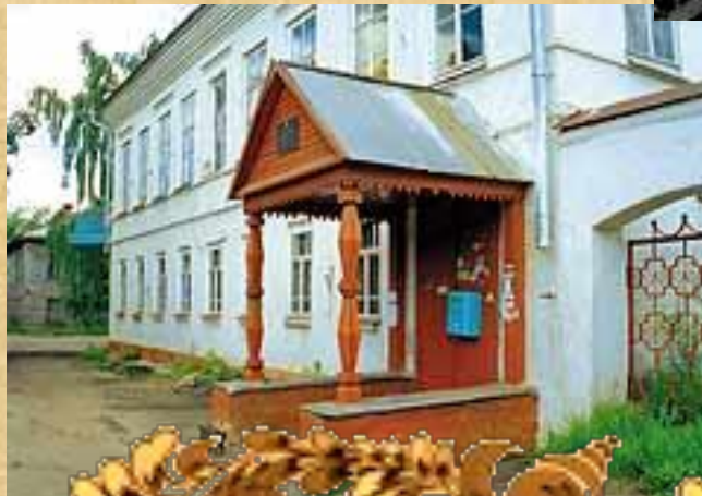
Старинный особняк, где мог жить Сквозник- Дмухановский