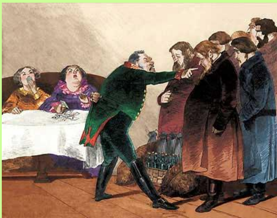
Торжество Городничего. Разговор с купцами