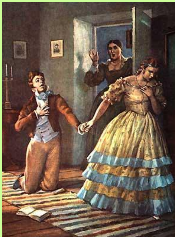
Объяснение в любви