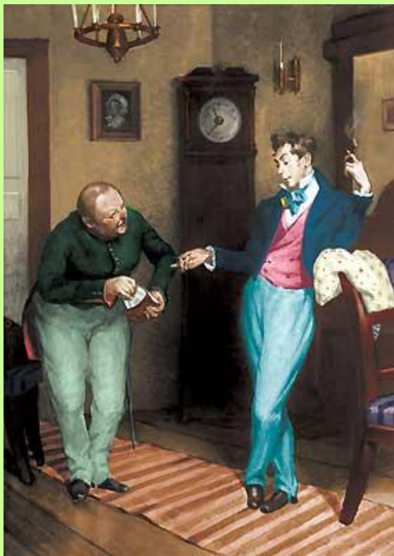
Хлестаков и Земляника