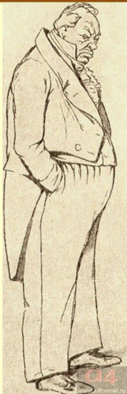
Аммос Фёдорович Ляпкин-Тяпкин (судья). Художник П.Боклевский