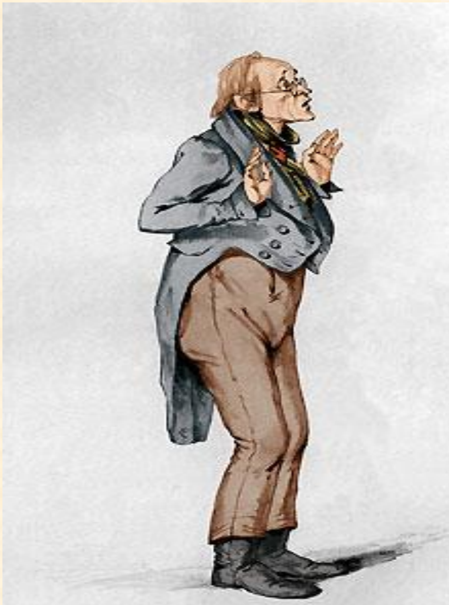
7. Лука Лукич Хлопов, смотритель училищ