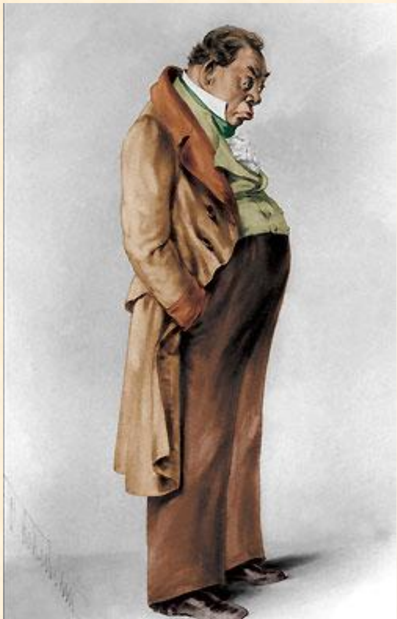
5. Аммос Федорович Ляпкин-Тяпкин, судья.