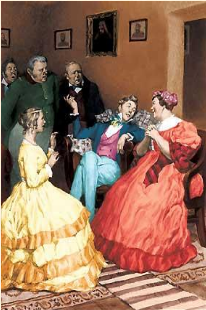
13. Сцена вранья