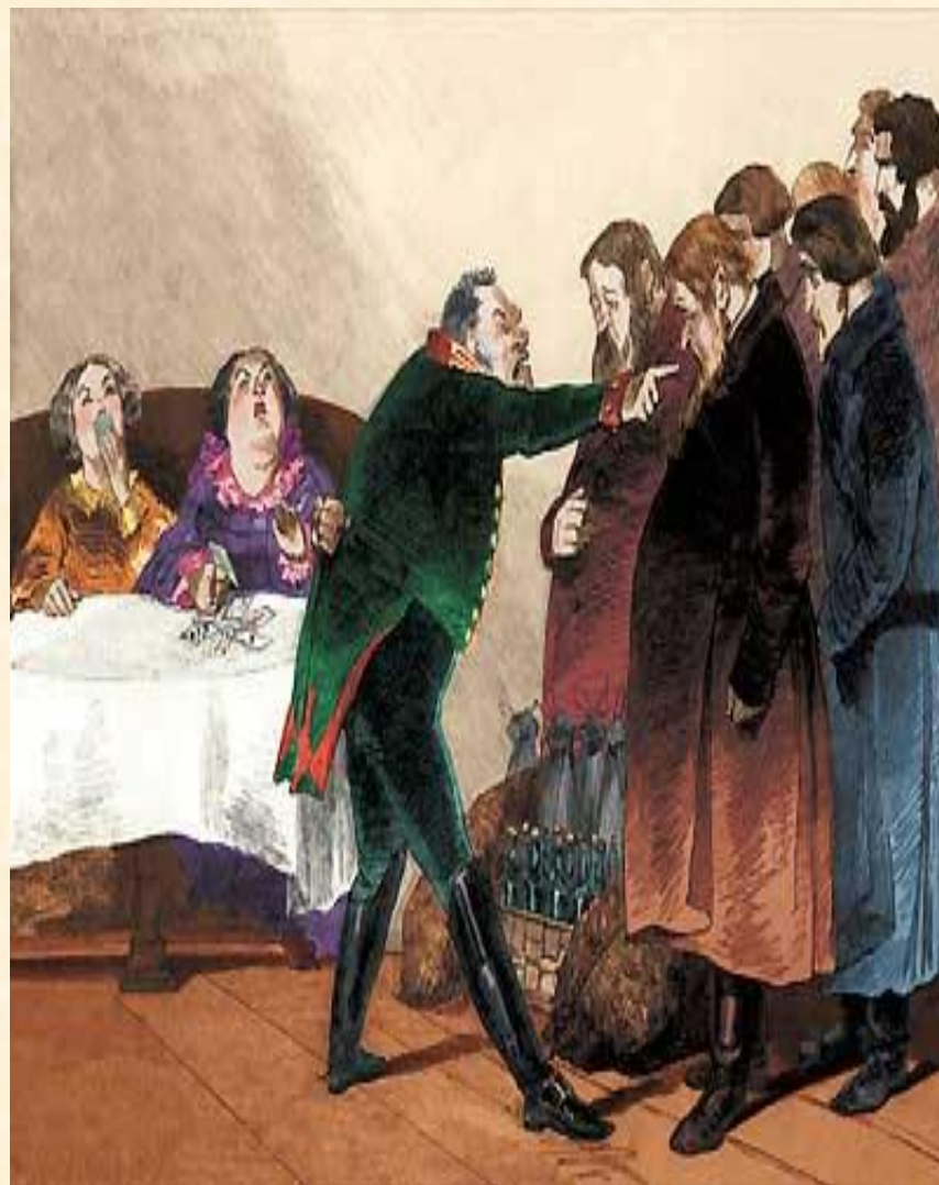
16. Торжество Городничего. Разговор с купцами