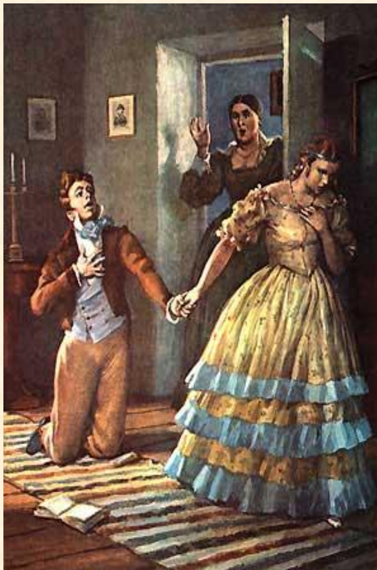
15. Объяснение в любви