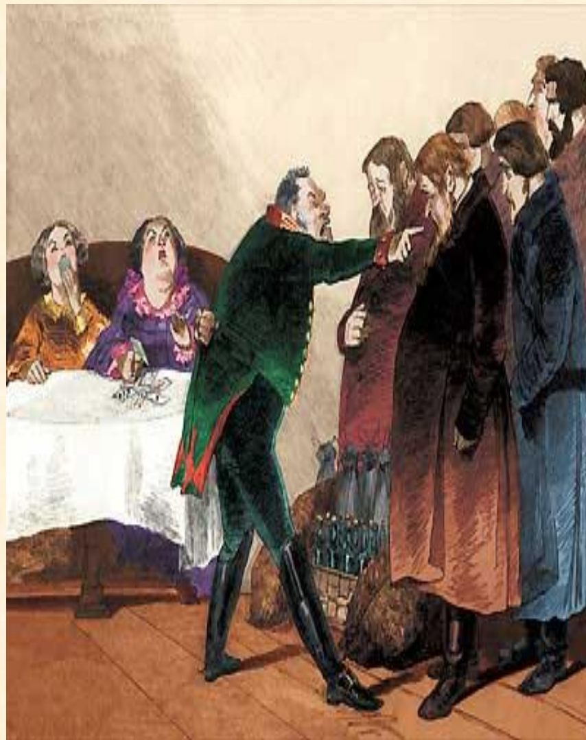
16. Торжество Городничего. Разговор с купцами