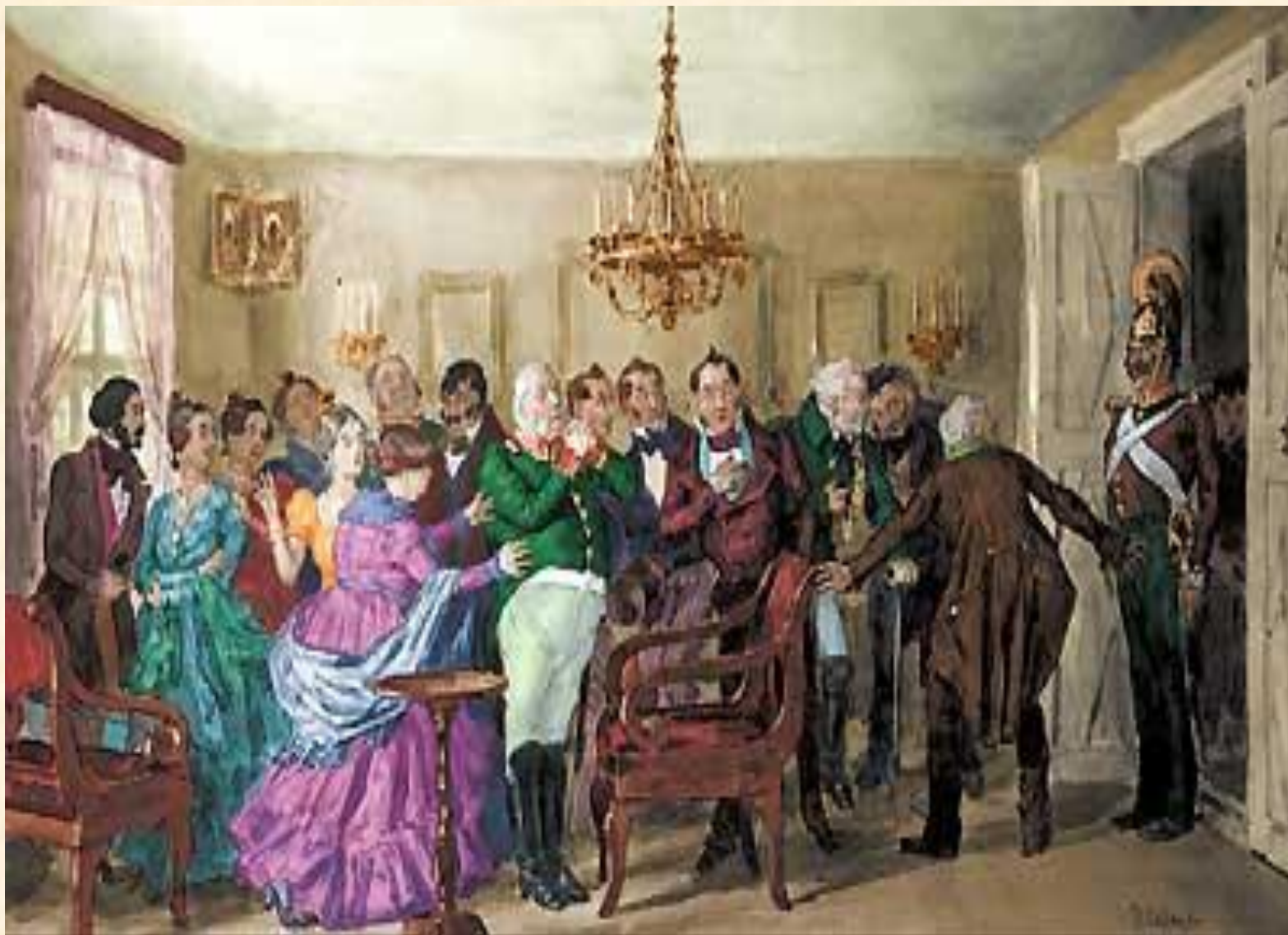
19. Немая сцена