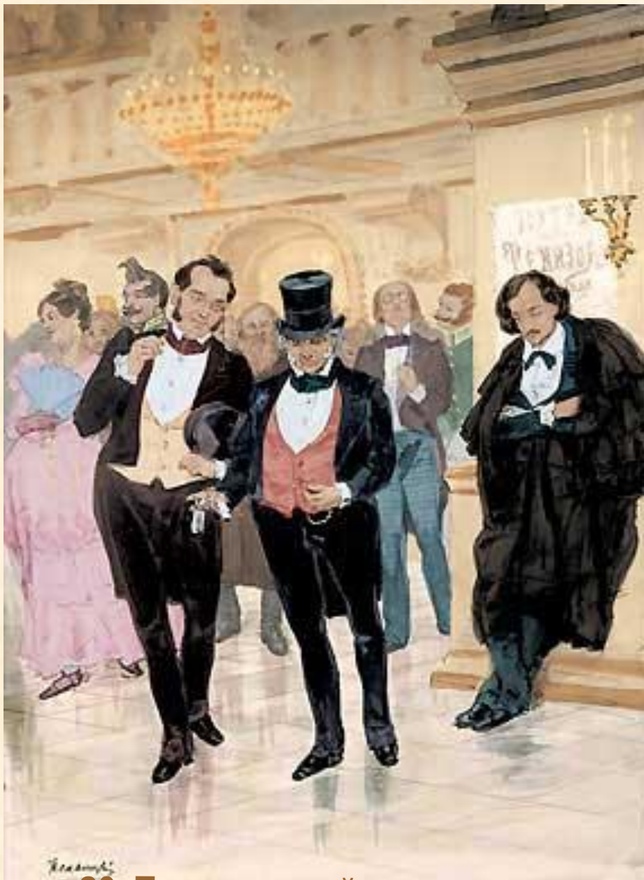
20. Театральный разъезд

«С хорошенькими актрисами знаком. Я ведь тоже разные водевильчики... Литераторов часто вижу. С Пушкиным на дружеской ноге. Бывало, часто говорю ему: «Ну что, брат Пушкин?»- «Да так, брат, - отвечает, бывало, - так как-то всё...» Большой оригинал.» (действие III, явл.6)