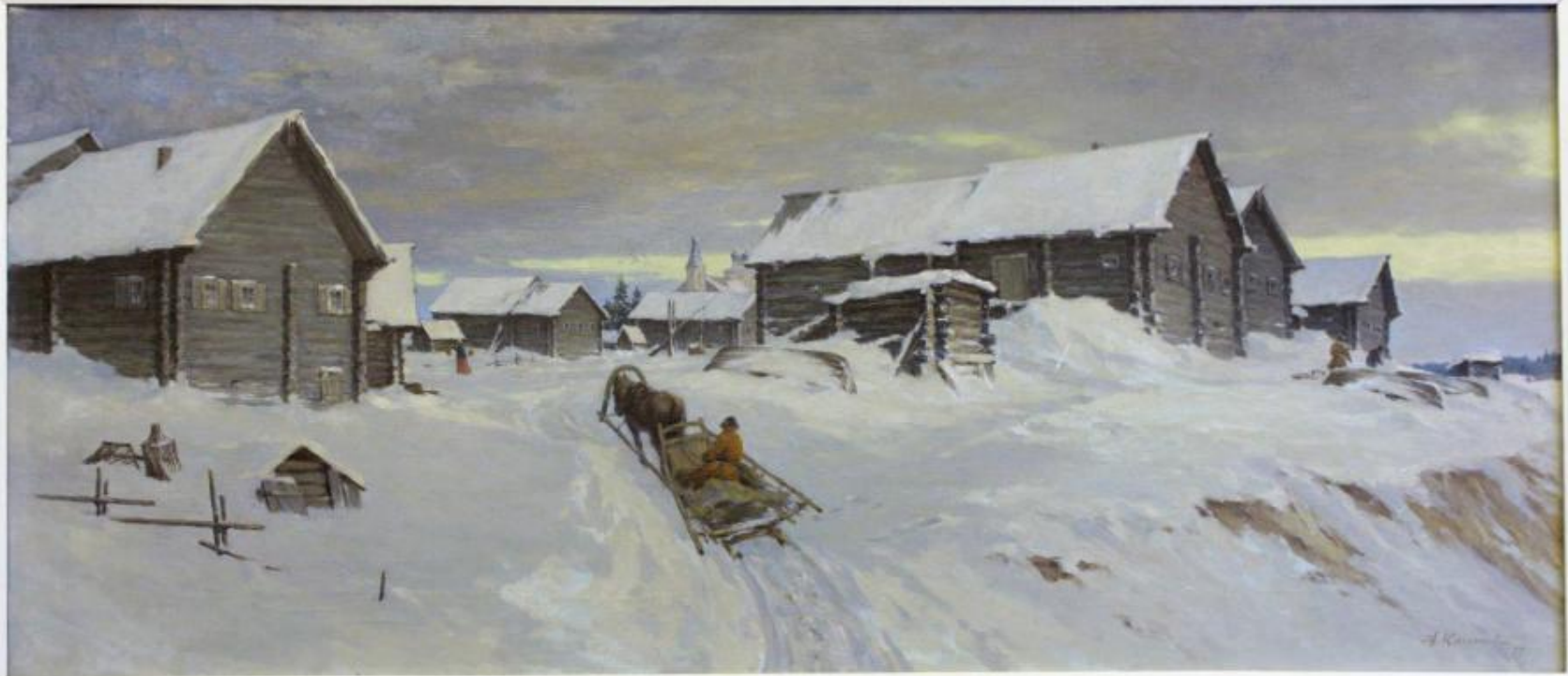
"Старая Денисовка" (1957 г.) Н. Кислякова