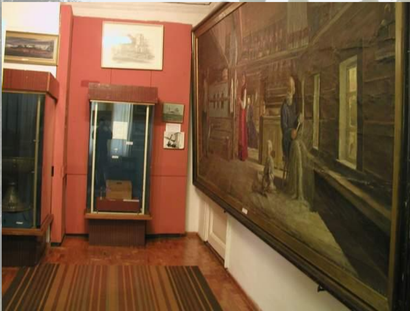
Зал №1 Север- родина Ломоносова