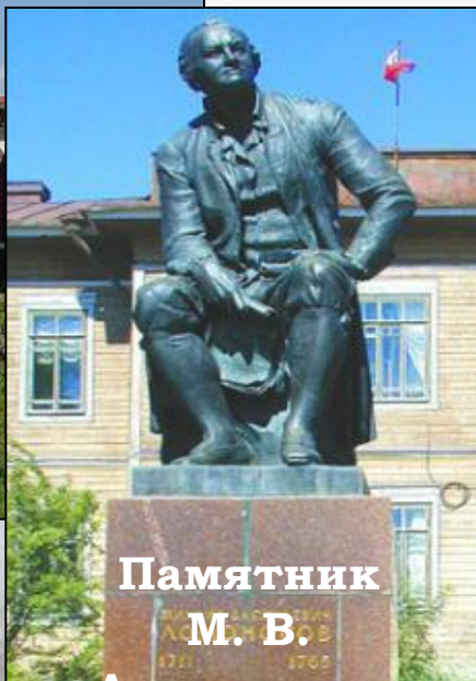
Памятник М. В. Ломоносову