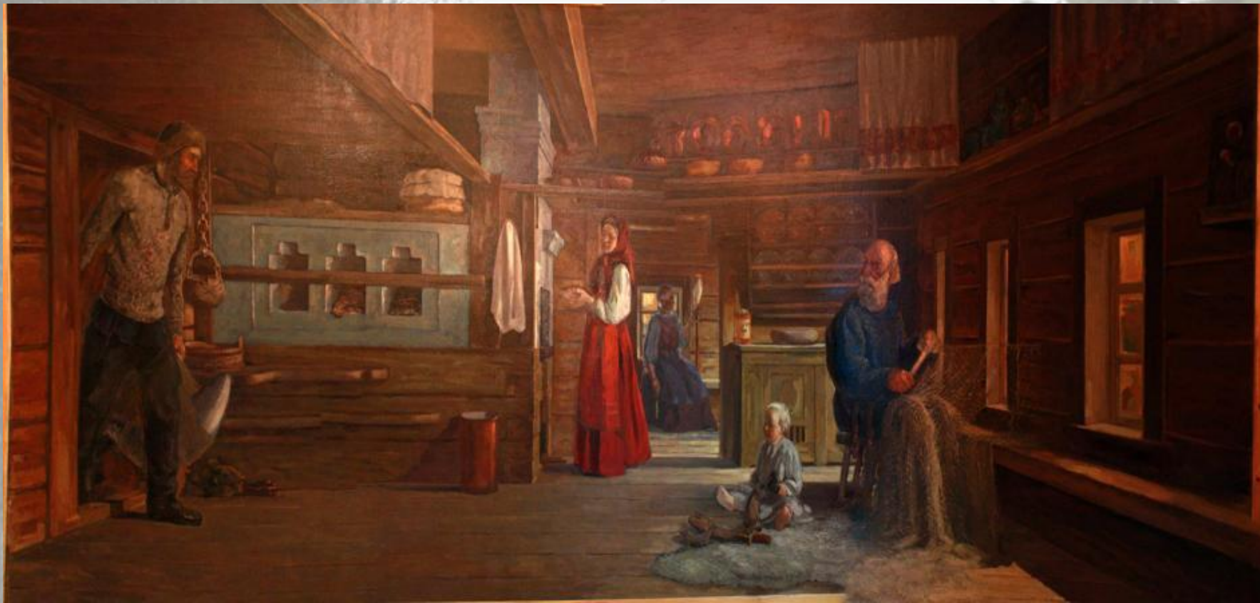
"Быт поморской семьи 18 века» Художник Румянцев А. Я.