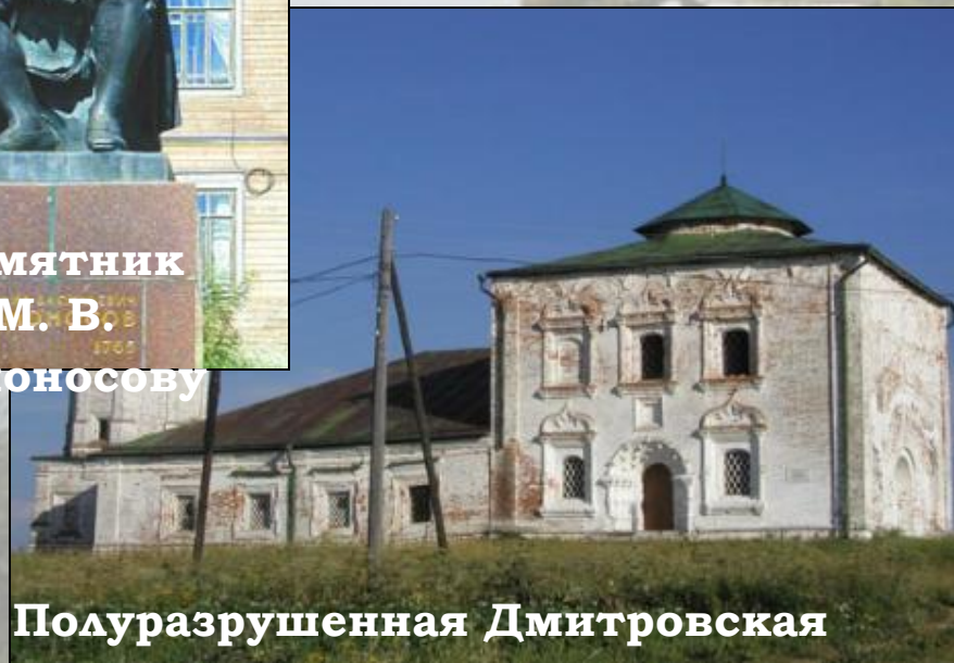
Полуразрушенная Дмитровская церковь