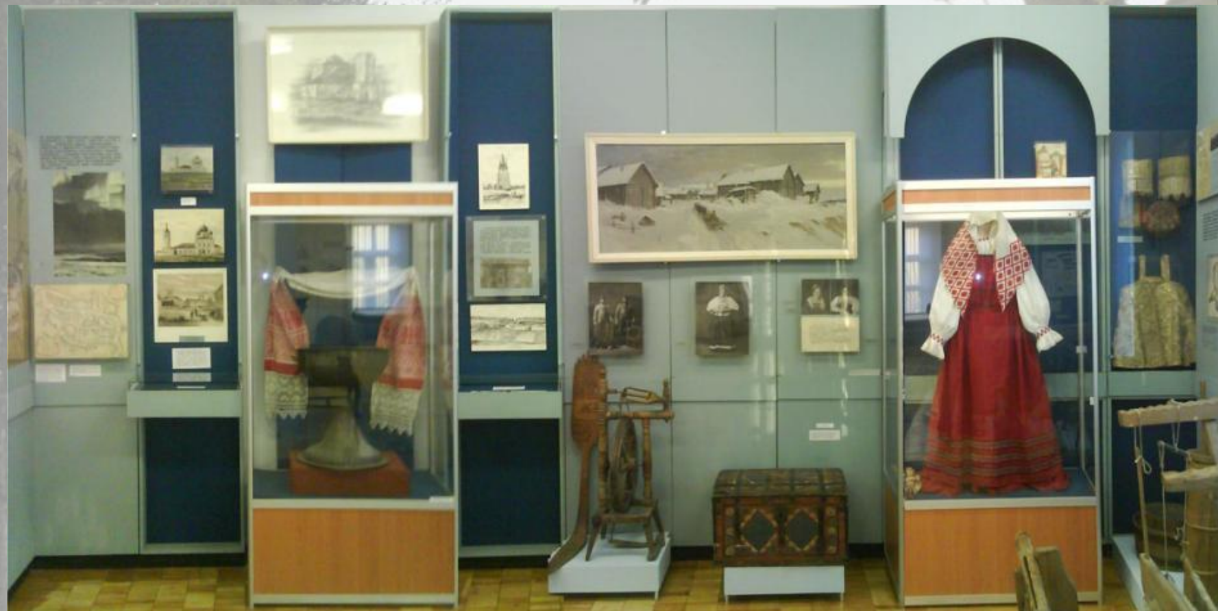
Зал №2 Север- родина Ломоносова