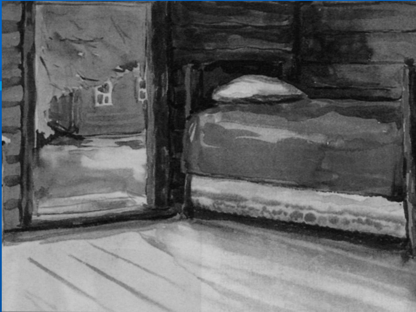
Любимый кабинет С.Есенина (амбар)