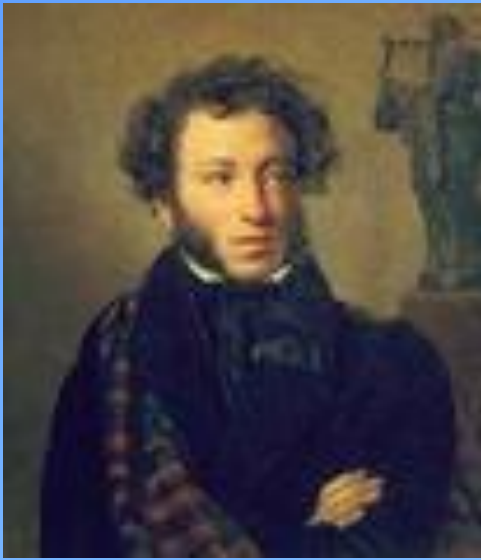
А.С. Пушкин – 37 лет