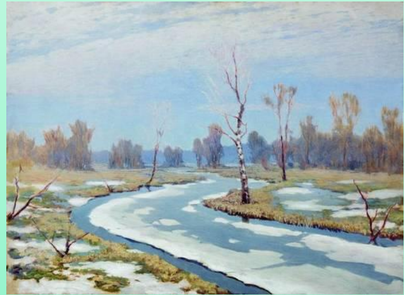
А. Куинджи Весна