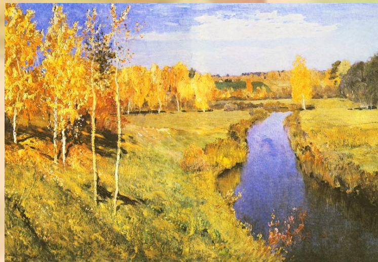
И. Левитан Золотая осень