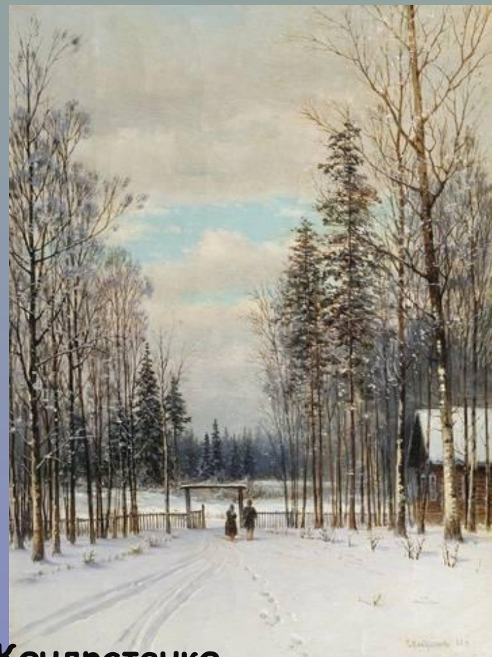
Г. Кондратенко Зима

Учись у них – у дуба, у березы. Кругом зима. Жесткая пора! Напрасные на них застыли слезы, И преснула, сжимаяся, кора. Все злей метель и с каждою минутой Сердито рвет последние листья, И за сердце хватается холод лютый; Они стоят молчат молчи и ты! Но верь весне. Ее промчится гений, Опять теплом и жизнью дыша. Для ясных дней, для новых откровений Переболит скорбящая душа.