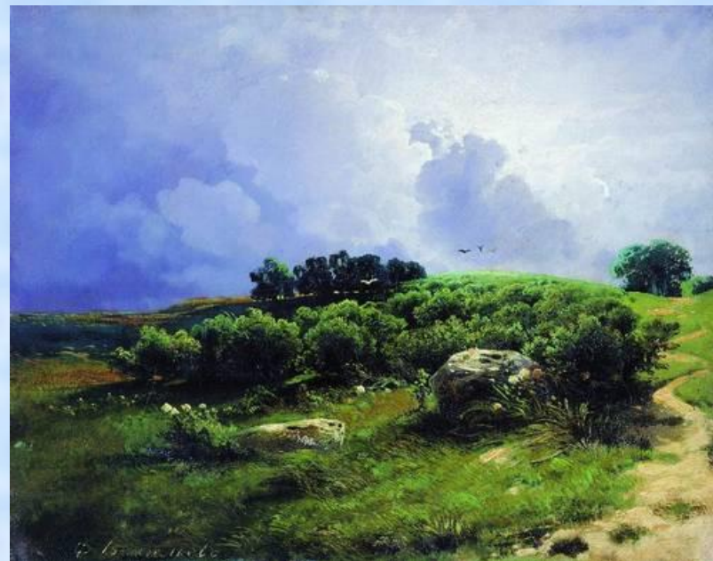
Ф. Васильев Перед грозой