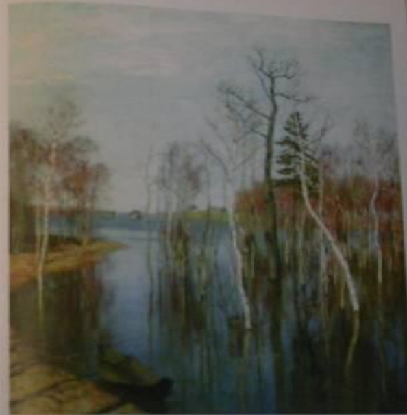
Николай Лермонтов, «Сосны на берегу реки»