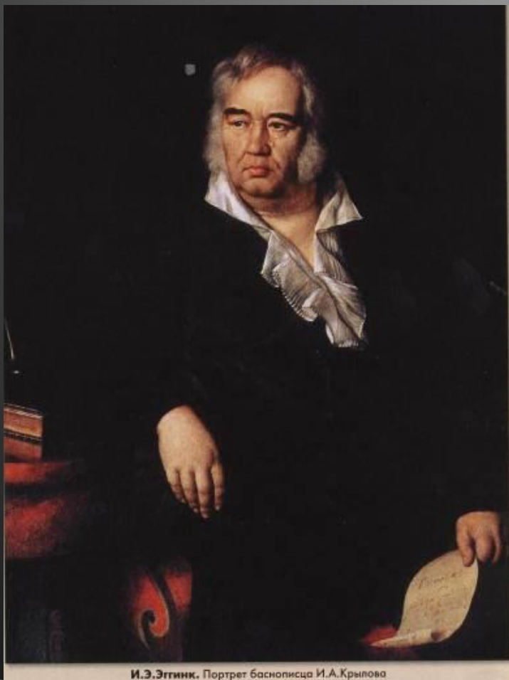
И.И.Жуковский. Портрет баснописца И.А.Крылова