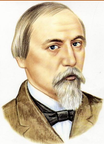
Некрасов Николай Алексеевич (1821-1877)