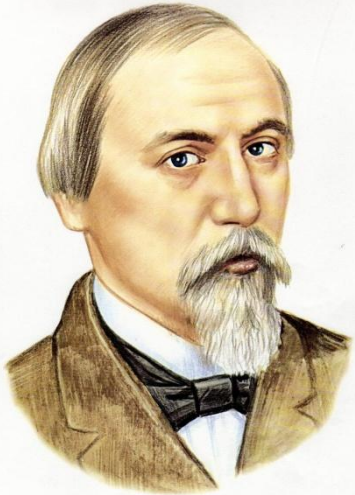
Некрасов Николай Алексеевич (1821-1877)