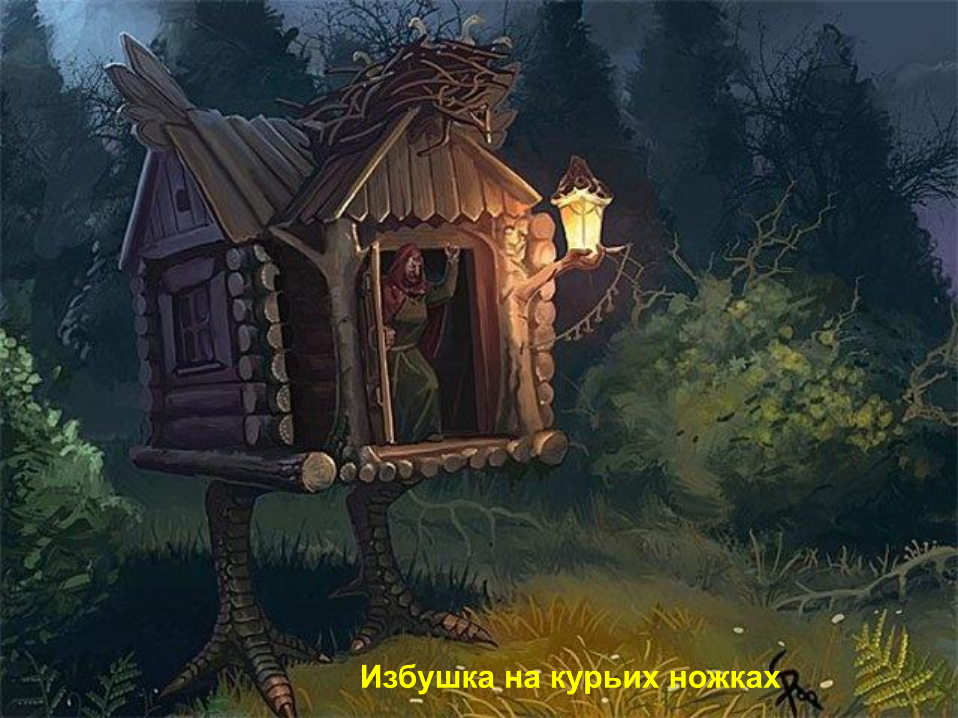
Избушка на курьих ножках