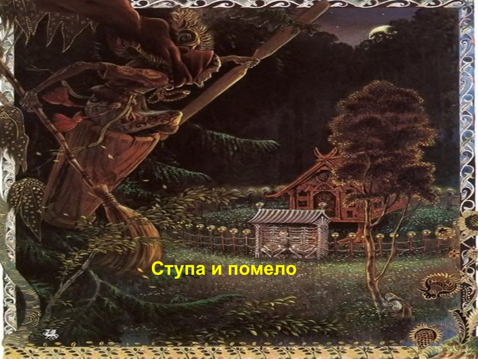
Ступа и помело