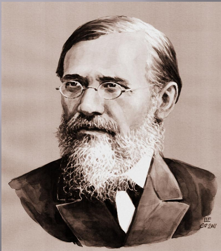
Василий Осипович Ключевский (1841-1911)