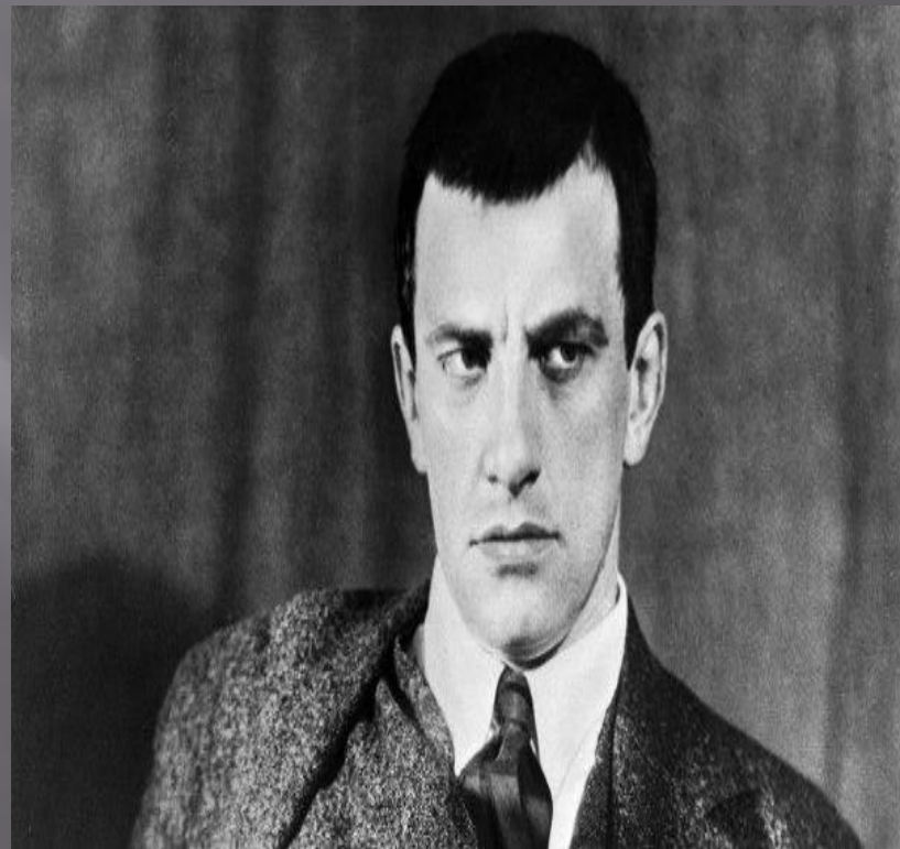
Владимир Владимирович Маяковский (1893-1930)

«Слово — полководец человечьей силы. Слово ласковое — мастер дивных див».