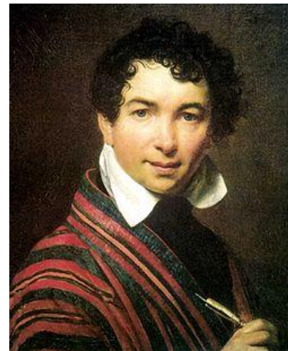
О. Кипренский 1782 -1836