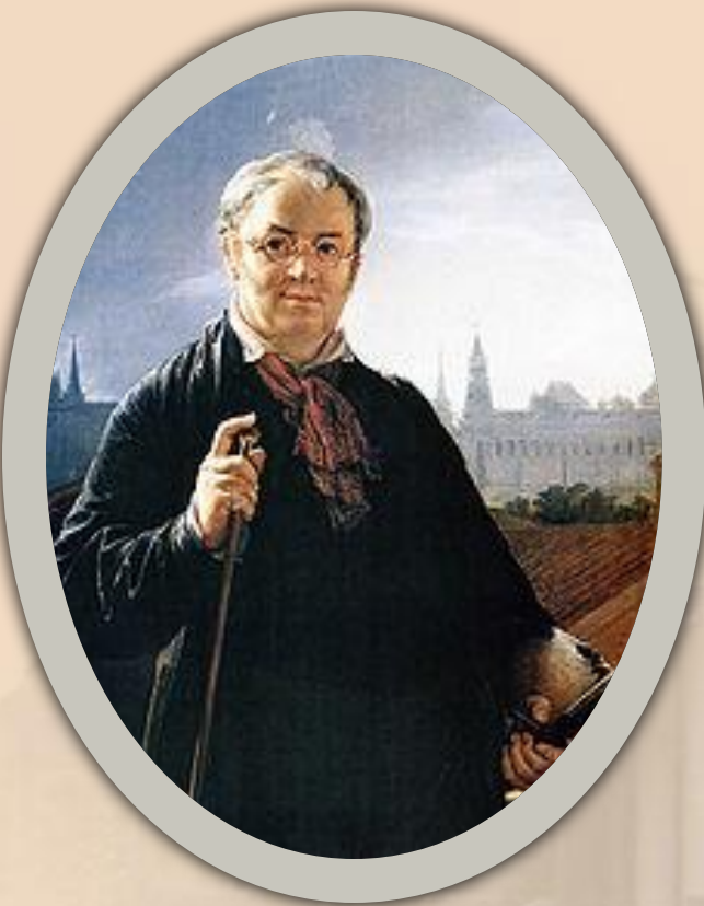
В. Тропинин 1776 -1857