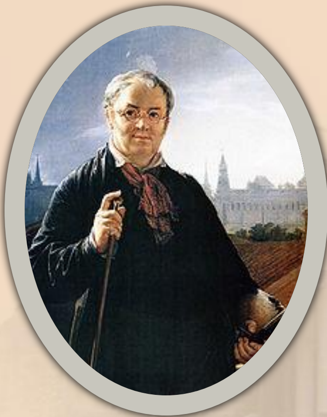
В. Тропинин 1776 -1857