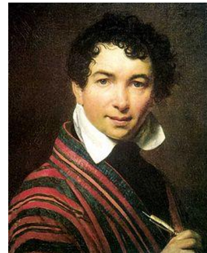
О. Кипренский 1782 -1836