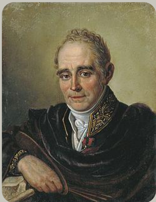
В. Боровиковский 1757 -1825