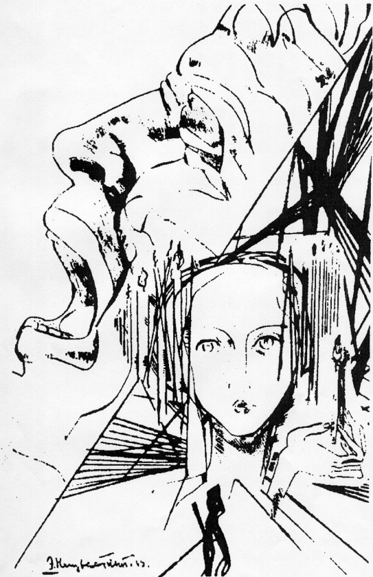
«Вера – отчаяние»