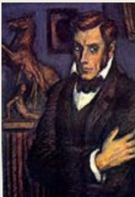
Иллюстрация к роману Гончарова