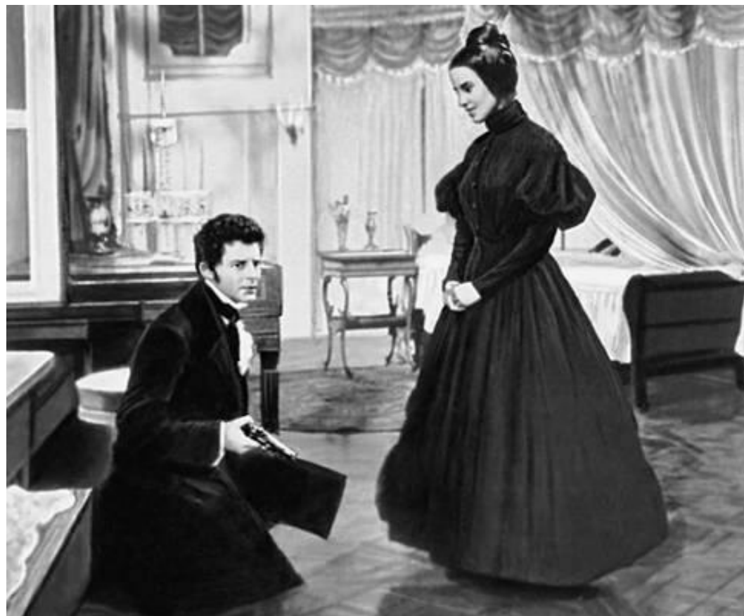
Кадр из фильма Отан-Лара Le rouge et le noir 1954 г.

Роман «Красное и черное», быть может, самый необыкновенный во французской литературе XIX века, прозвучал как грозное предупреждение: настанет время, когда Жюльены Сорели – молодые плебеи, умеющие пылко мечтать о лучшем будущем и бесстрашно бороться за свое счастье, – сумеют найти верный путь!