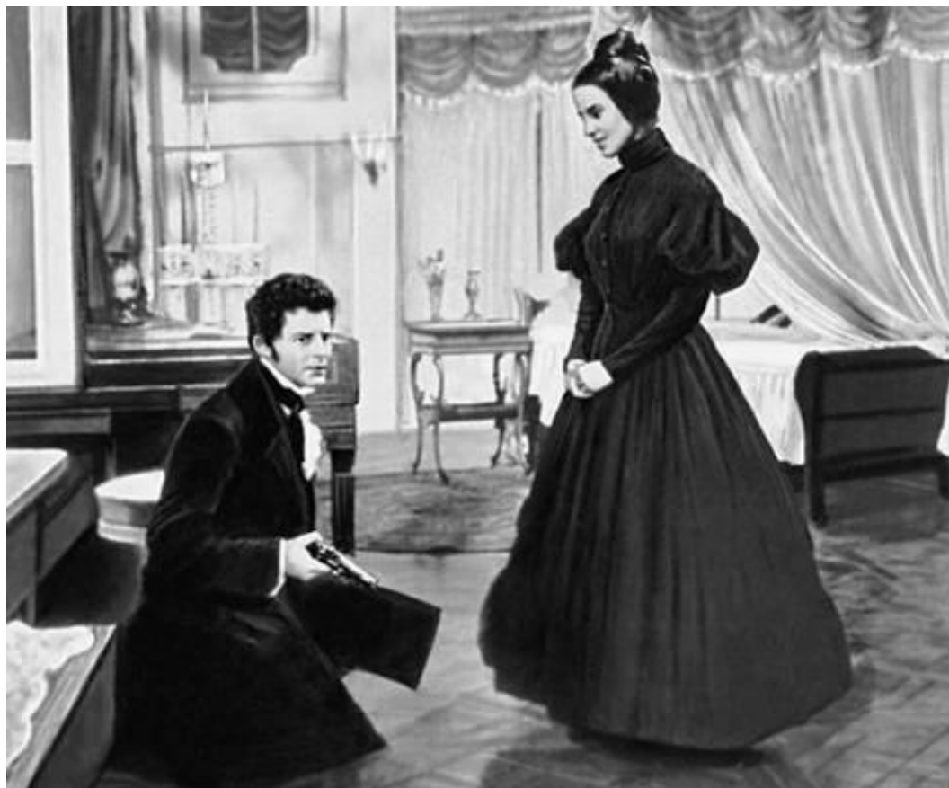
Кадр из фильма Отан-Лара Le rouge et le noir 1954 г.

Роман «Красное и черное», быть может, самый необыкновенный во французской литературе XIX века, прозвучал как грозное предупреждение: настанет время, когда Жюльены Сорели – молодые плебеи, умеющие пылко мечтать о лучшем будущем и бесстрашно бороться за свое счастье, – сумеют найти верный путь!