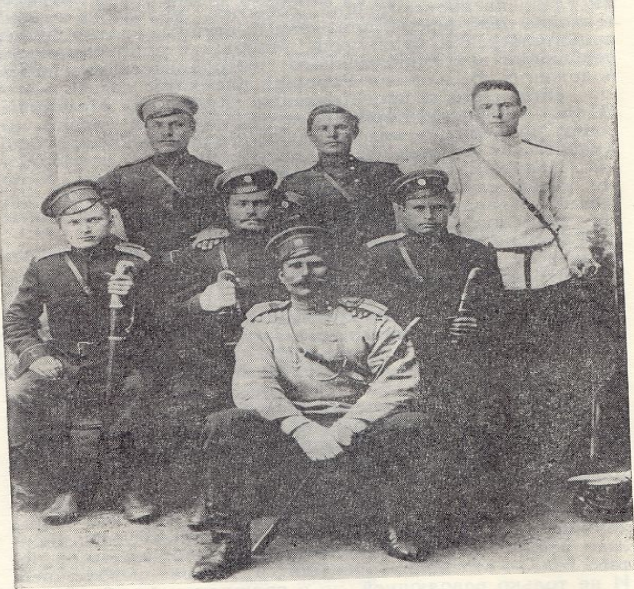
Так выглядели донские казаки, о которых писал Михаил Александрович Шолохов в первой и второй книгах «Тихого Дона».