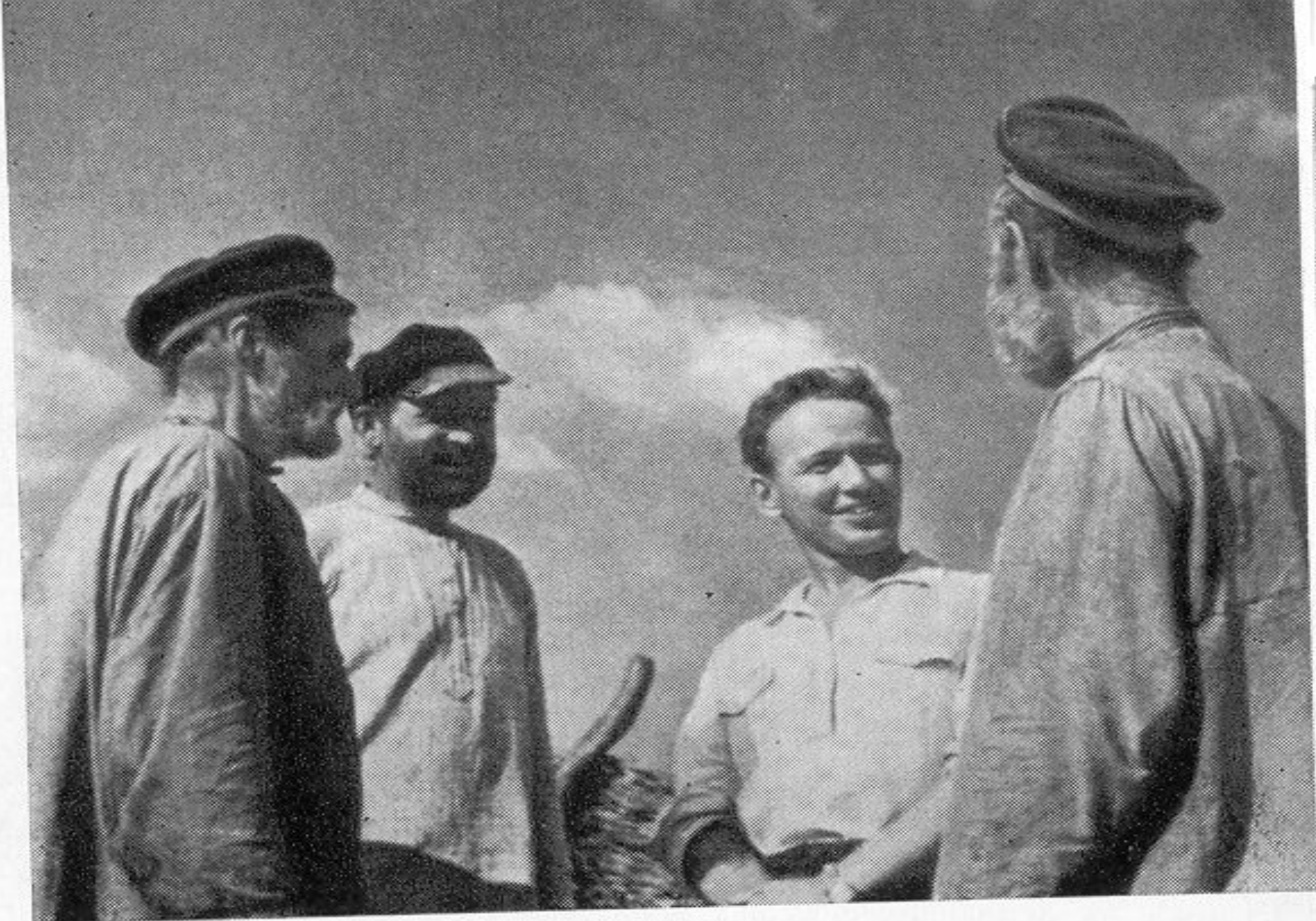
Сыны Тихого Дона.