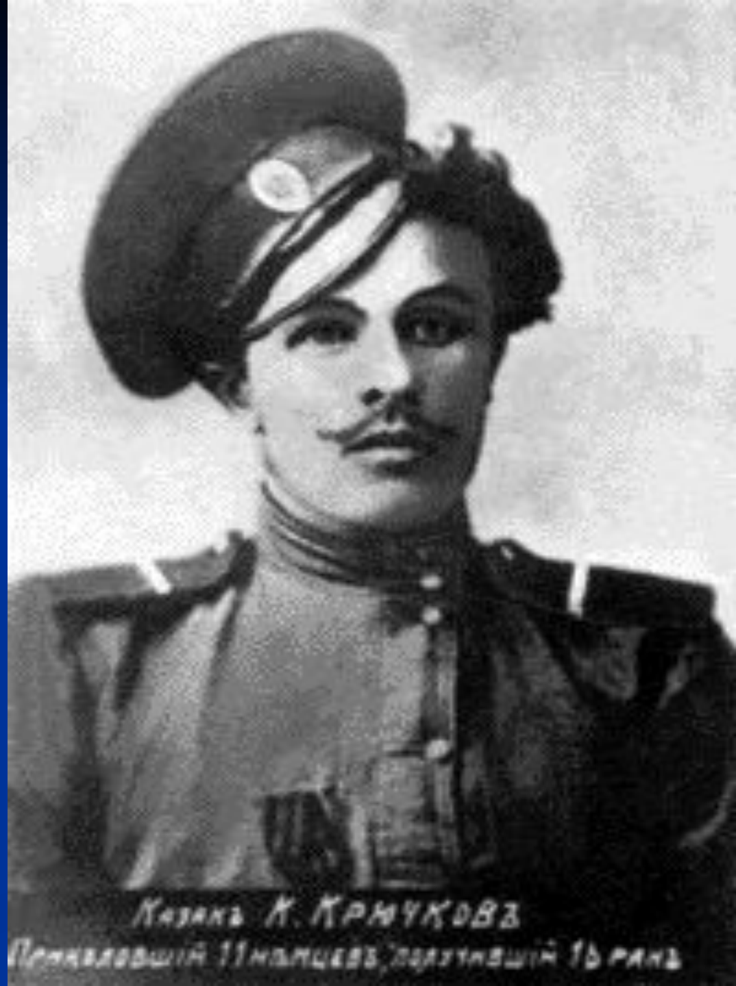
Казакъ К. КРЮЧКОВЪ Полковникъ 11-го пехотнаго полка, гвардейскаго 1-го пехотнаго полка