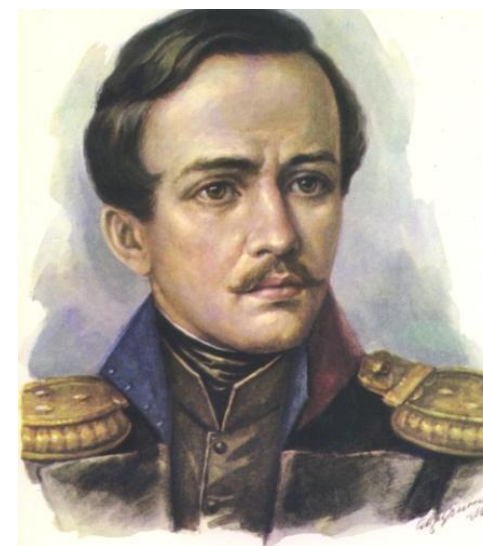
Михаил Юрьевич Лермонтов (1814—1841)