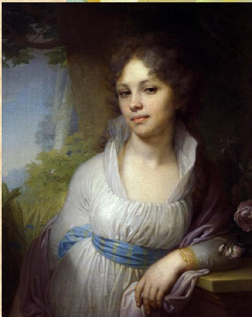
В. Боровиковский. Портрет Лопухиной