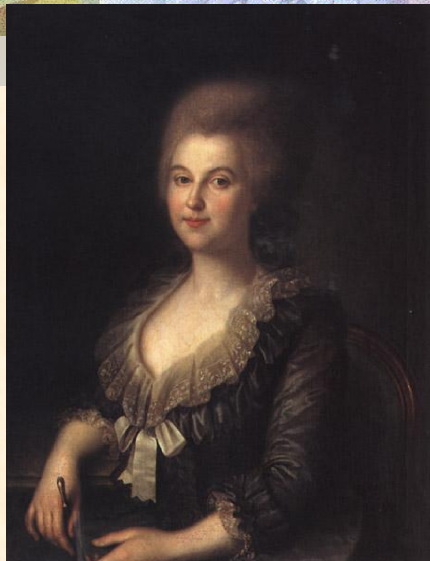
И. Аргунов. Портрет Ветошниковой