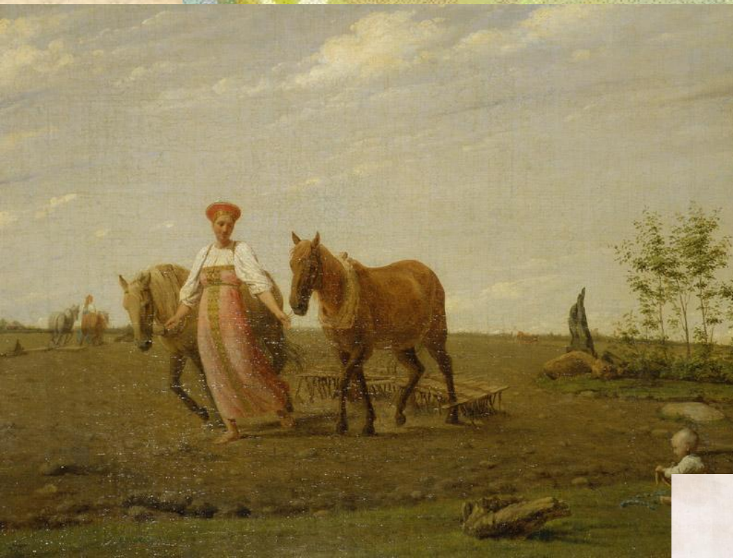
А. Веницианов. На пашне. Весна