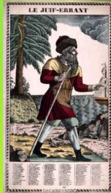
«Легенда о Вечном Жиде»

Что объединяет библейские легенды и легенды, рассказанные старухой