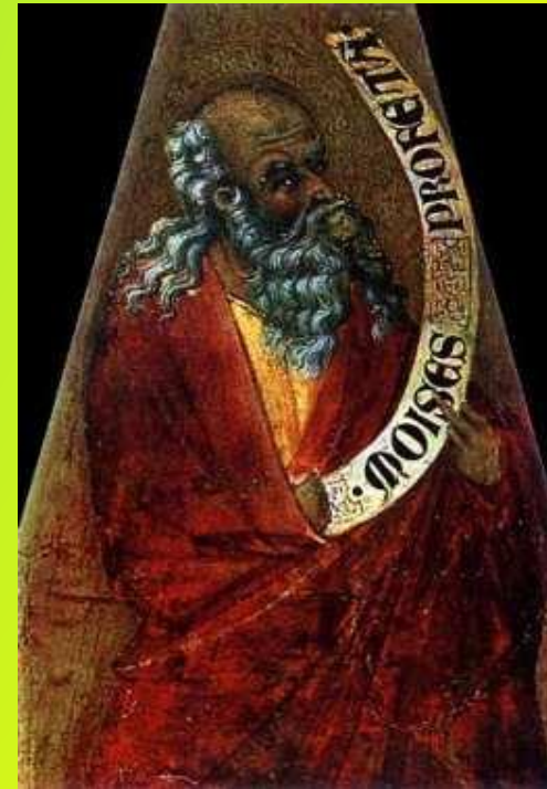
«Легенда о Моисее»