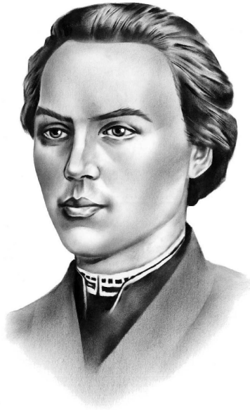
Маркіян Шашкевич (1811—1843)