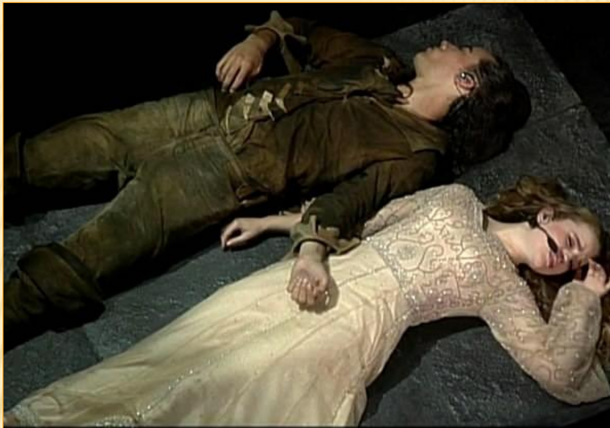
Изображение сцены смерти Ромео и Джульетты