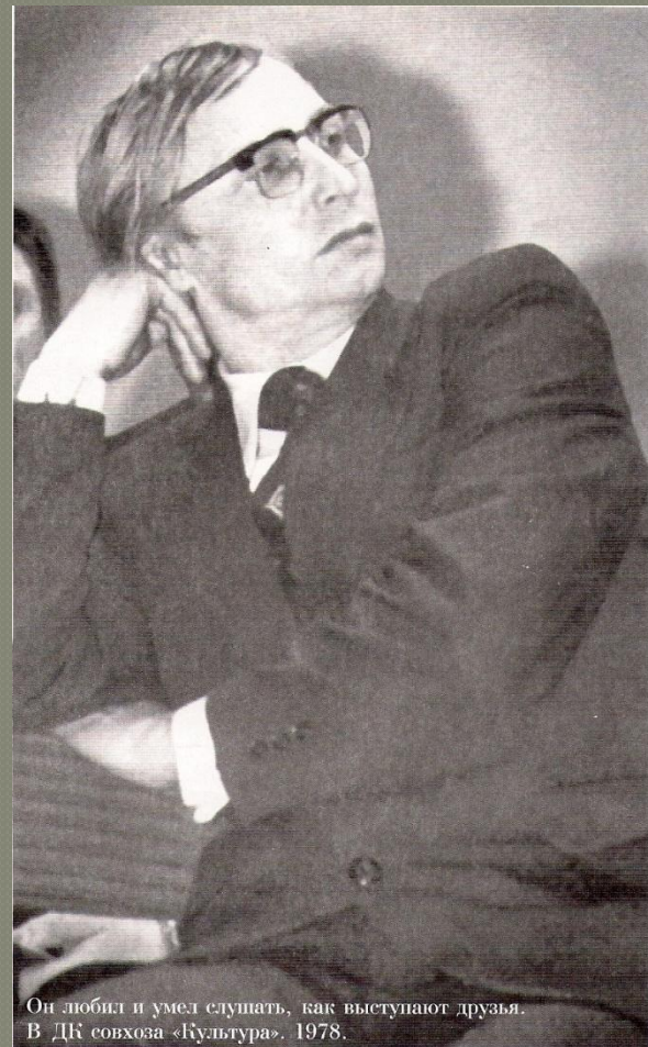
Он любил и умел слушать, как выступают друзья. В ДК совхоза «Культура». 1978.