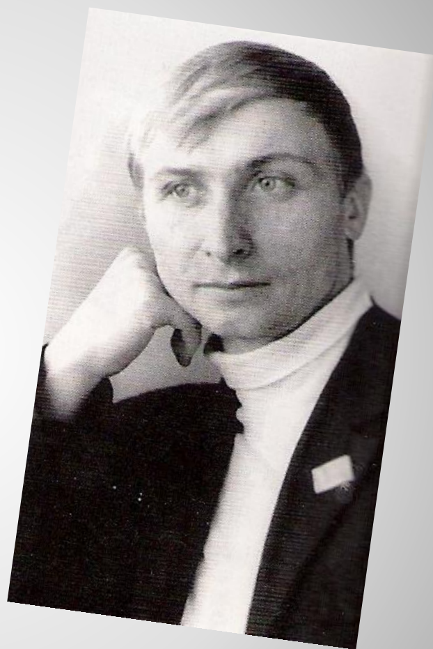
Россия С.Есенина и Россия Н.Поснова