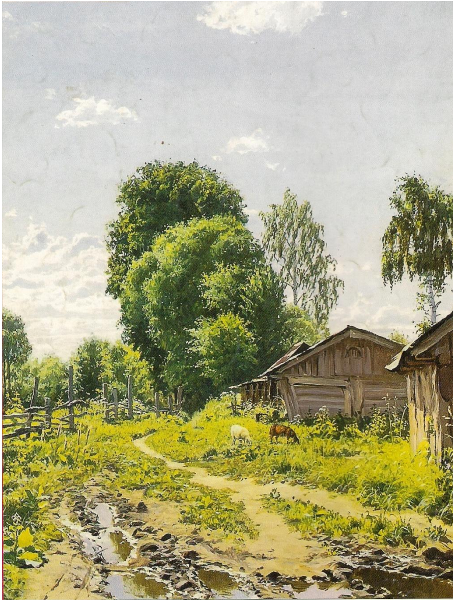
В деревне. Худ. А. Герасимов. 1993