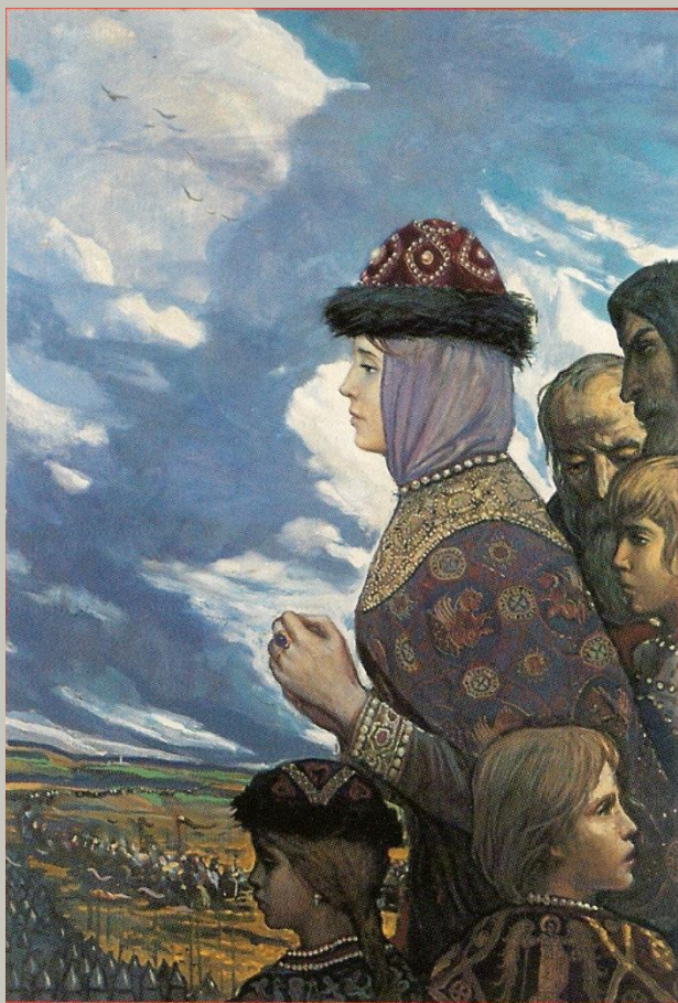
Проводы войска (Из цикла «Поле Куликово»). Худ. Илья Глазунов. 1980 К статье на стр. 95

О Русь моя! Как велика Твоя история. Невольно Твои минувшие года Волнуют счастливо и больно.