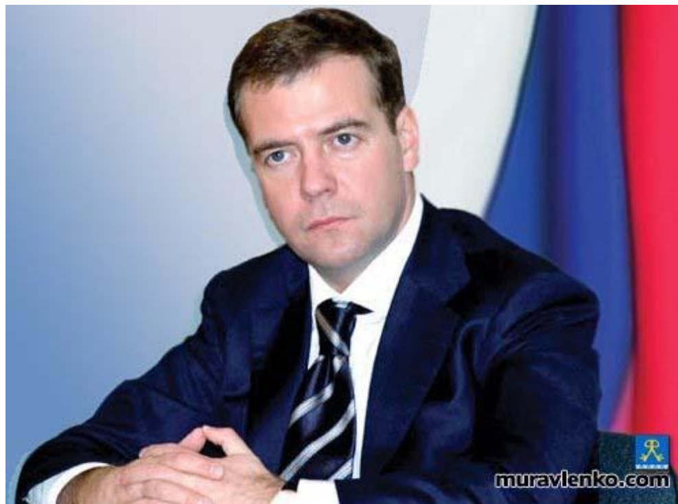
Дмитрий Анатольевич Медведев