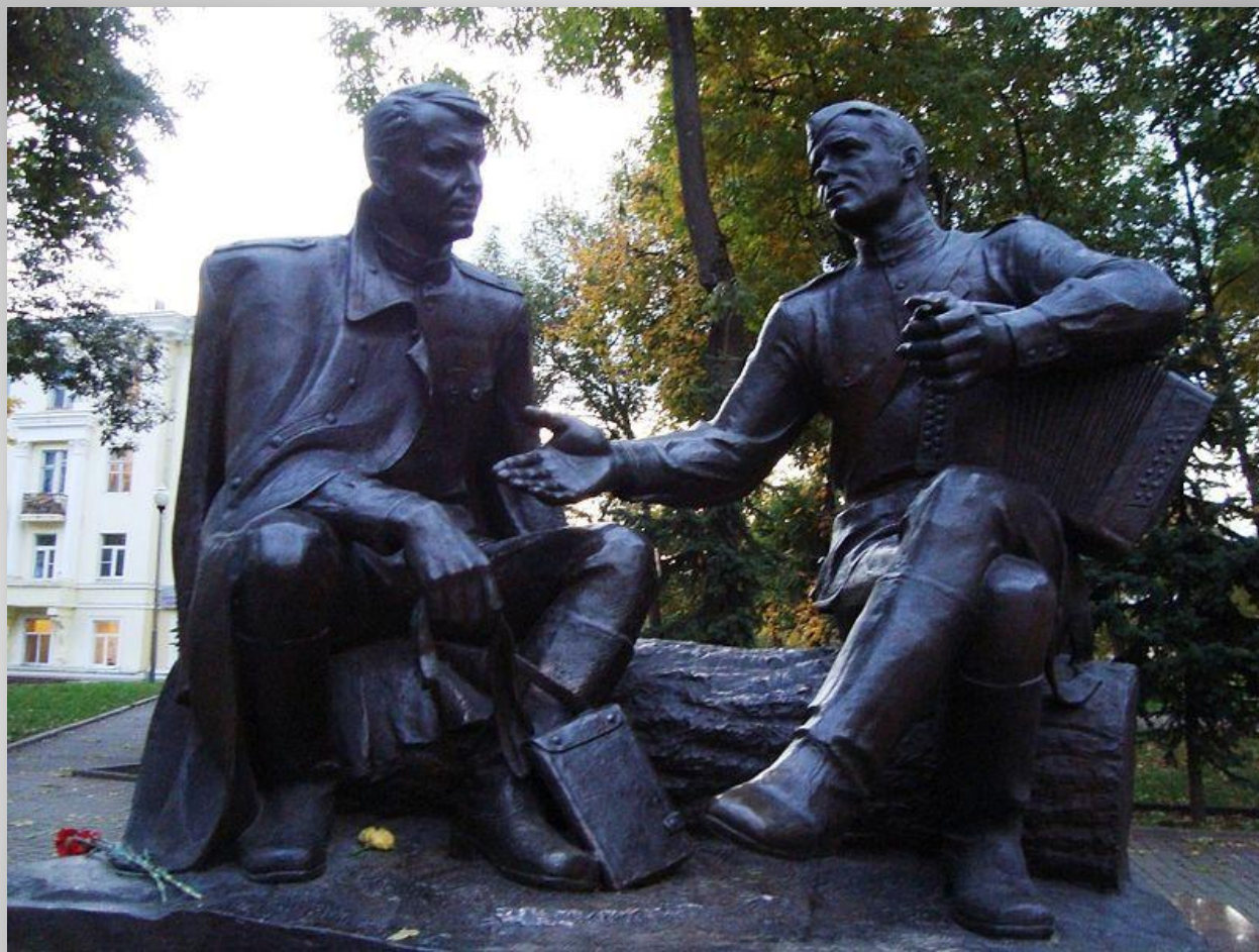
Памятник Твардовскому и Василию Тёркину в Смоленске