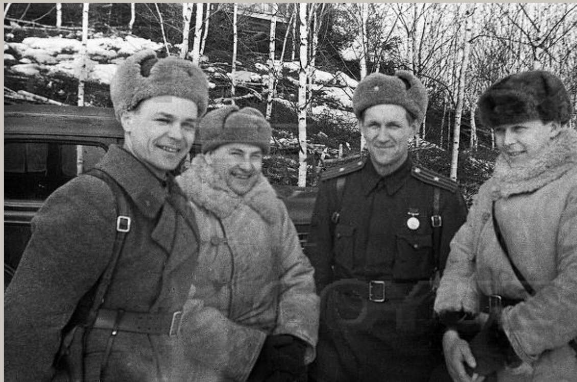
А. Т.Твардовский (справа) на фронте

На долю А.Твардовского выпало тяжёлое время – Великая Отечественная Война, послевоенная разруха, годы великих потрясений, строительство нового мира. Но какими бы суровыми не были испытания, он всегда оставался верным идеалам служения Родине. Именно поэтому он пошёл добровольцем на войну, был вместе со своей страной в горе и радости