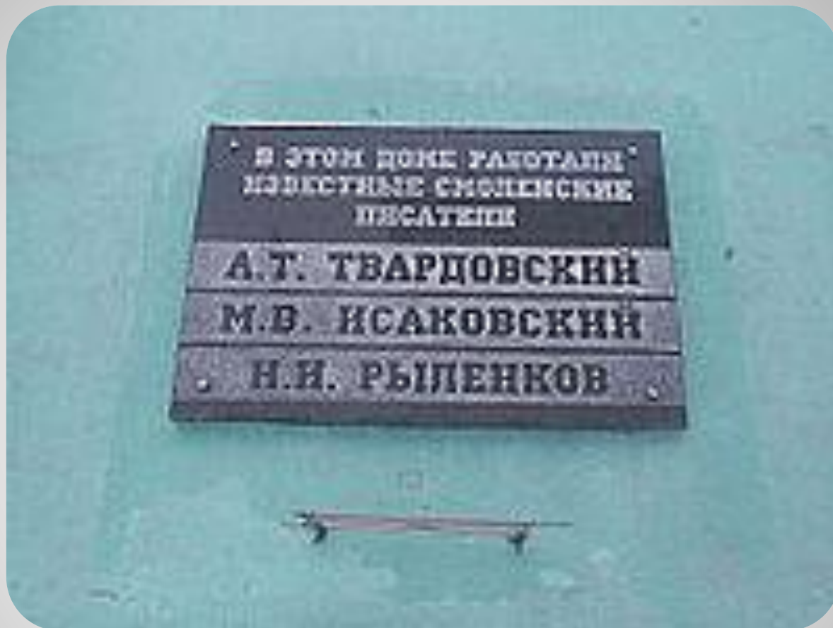
Мемориальная доска на Смоленском Доме книги