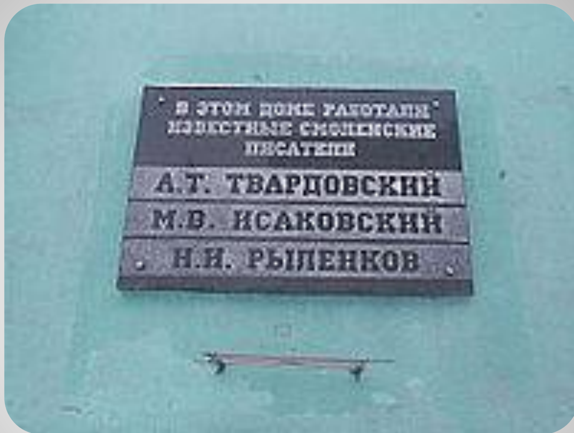
Мемориальная доска на Смоленском Доме книги