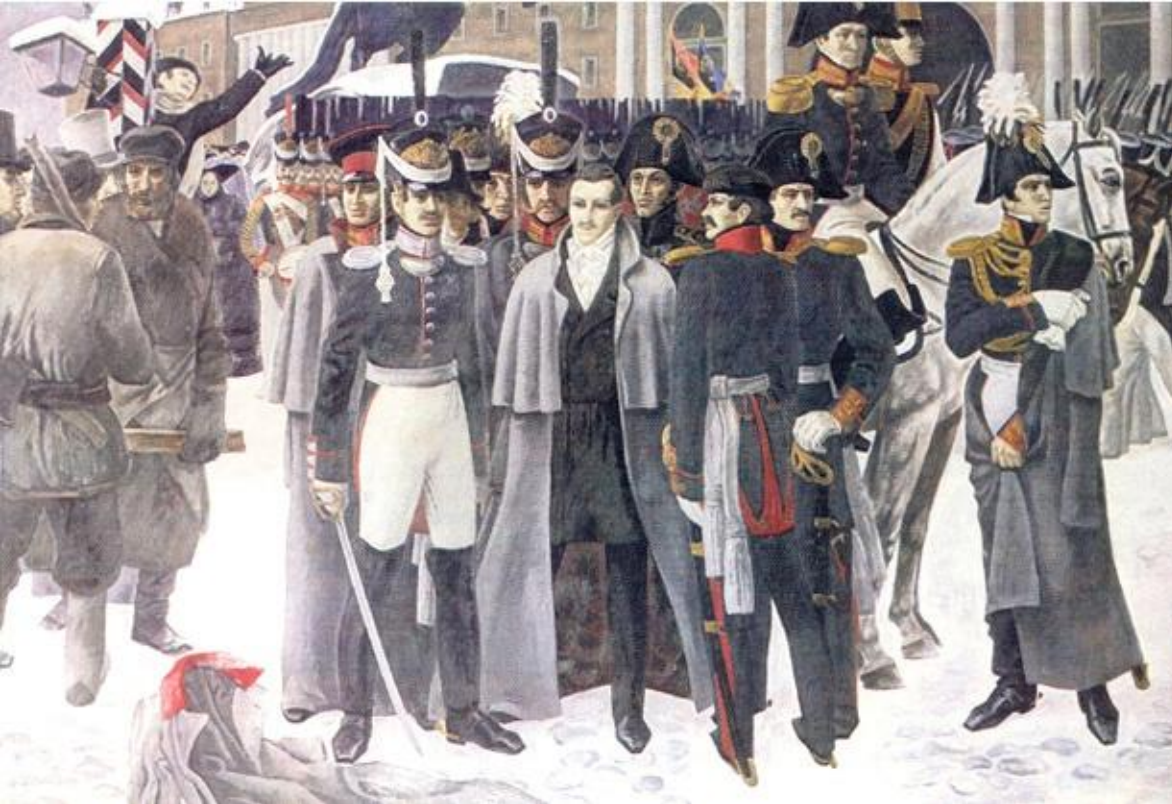
Декабристы на Сенатской площади.