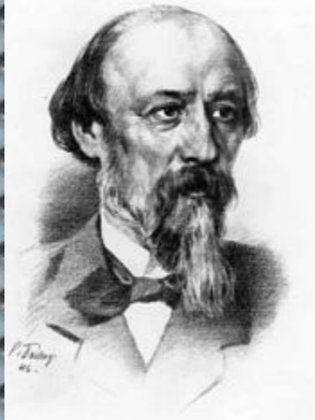
Н.А.Некрасов - редактор журнала "Современник".

В 50-е годы журнал «Современник» объединял вокруг себя крупнейших демократических и либерально настроенных писателей. К концу 50-х годов писатели умеренного направления окончательно порывают с журналом, и он становится органом революционной демократии. Идейным руководителем журнала стал Чернышевский. Революционно-демократический лагерь в литературе представляли также Герцен, Добролюбов, Некрасов, Салтыков-Щедрин. Им противостояли литераторы, тяготевшие к либеральным и умеренно монархическим взглядам. Наиболее значительными из них были Тургенев и Гончаров. Однако назревшая необходимость буржуазно-демократических преобразований и наличие демократического подъема в стране помогали в ряде случаев и этим художникам сохранить в своем творчестве глубину и силу социальной критики.