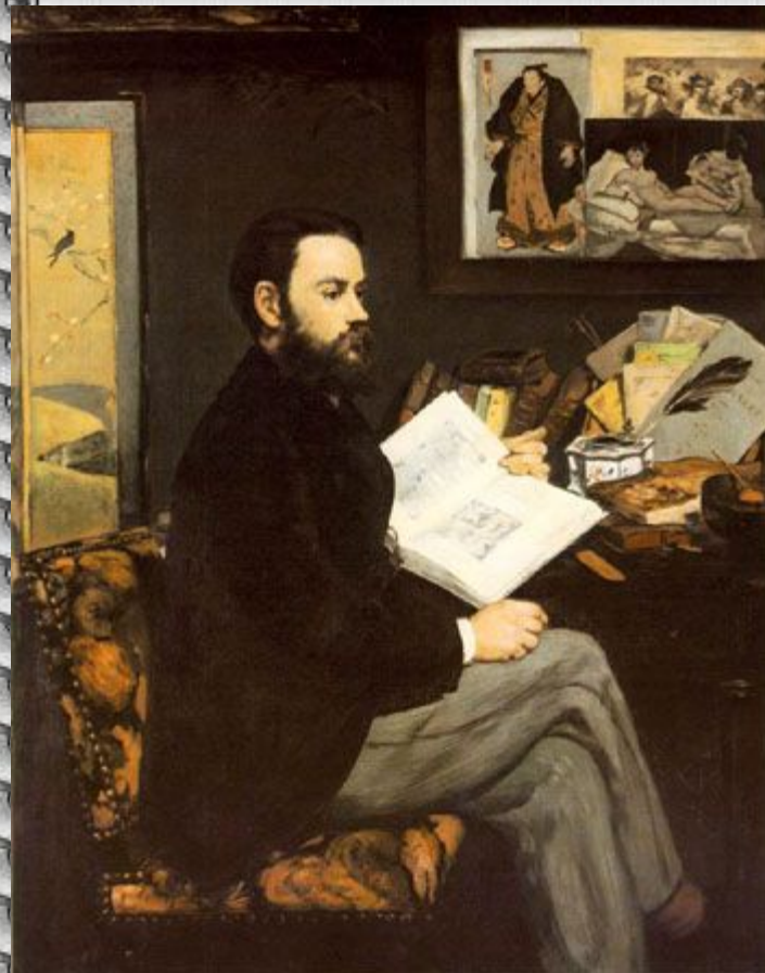
Э. Мане. Портрет Эмиля Золя

Русские художники не были отделены от того, что происходило за рубежом.