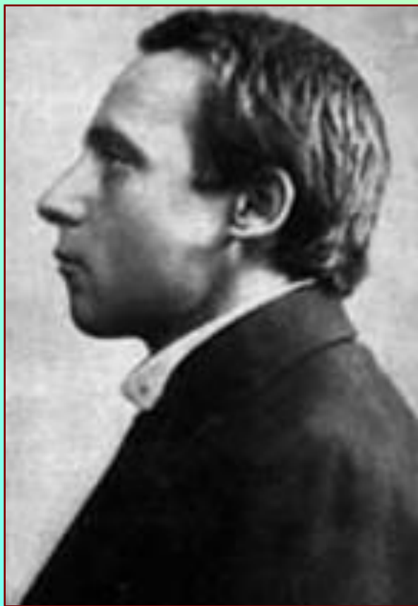
Хлебников Велимир (Виктор Владимирович) 1885-1922

Крупнейший представитель русского авангарда, поэт, прозаик, драматург, философ. Родился 9 ноября 1885 года в Астраханской губернии. В 1908 году переехал в Петербург, поступил на 3-й курс естественного отделения физико-математического факультета. С осени 1909 г. перешел на факультет восточных языков по разряду санскритской словесности, вслед за этим перешел на 1-й курс славяно-русского отделения историко-филологического факультета.