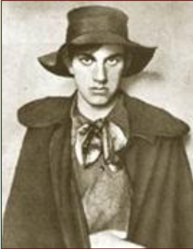
Владимир Маяковский 1893-1930

Родился 7 июля 1893 в селе Багдади в семье лесничего. Маяковский учился в московской гимназии. Трижды подвергался арестам, в 1909 был заключён в одиночную камеру Бутырской тюрьмы. Выйдя из тюрьмы, где он начал писать стихи, Маяковский решает "делать социалистическое искусство": "Я прервал партийную работу. Я сел учиться".