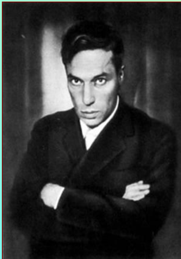
Борис Пастернак 1890-1960

Поэт, переводчик, прозаик. Родился 29 января в Москве в семье известного художника. Его первые сборники стихов ("Блинец в тучах". 1914; "Поверх барьеров", 1917) отмечены влиянием символизма и футуризма. Вместе с Н.Асеевым он организовал группу новых или «умеренных» футуристов – «Центрифуга».