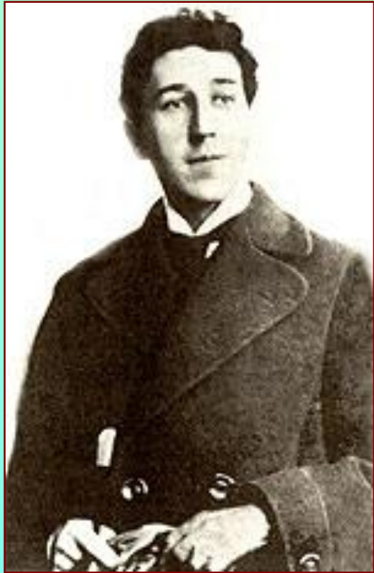
Игорь Северянин (Лотарев Игорь Васильевич) 1887-1941

Родился в Петербурге в семье офицера (по материнской линии – потомок Карамзина и дальний родственник Фета). Стихи сочинял с детства, первое стихотворение о русско-японской войне появилось в печати в 1905 в журнале «для солдат и нижних чинов» «Досуг и дело».