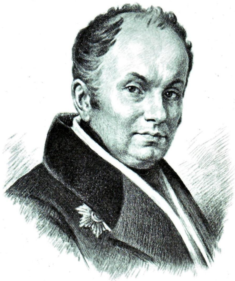
Василий Андреевич ЖУКОВСКИЙ (1783—1852)

После «Руслана и Людмилы» Жуковский надписал Пушкину свою фотографию: «Победителю-ученику от побежденного учителя». Жуковский был рядом с Пушкиным на протяжении почти всей его жизни. Он неоднократно заступался за Пушкина перед царем и находился у постели смертельно раненного поэта в его последней квартире на набережной реки Мойки, в доме 12. Он вывешивал сообщения о состоянии великого поэта.