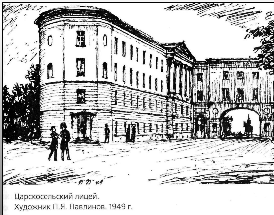
Царскосельский лицей. Художник П.Я. Павлинов. 1949 г.

Спорили о политике и литераторы. В литературных кружках и обществах писатели вели жаркие дискуссии друг с другом — в Обществе любителей российской словесности, «Арзамасе», «Зеленой лампе» — так назывались некоторые из литературных обществ. Возникали новые литературные журналы и альманахи. Книга, журнал стали объектами увлечения и даже моды.